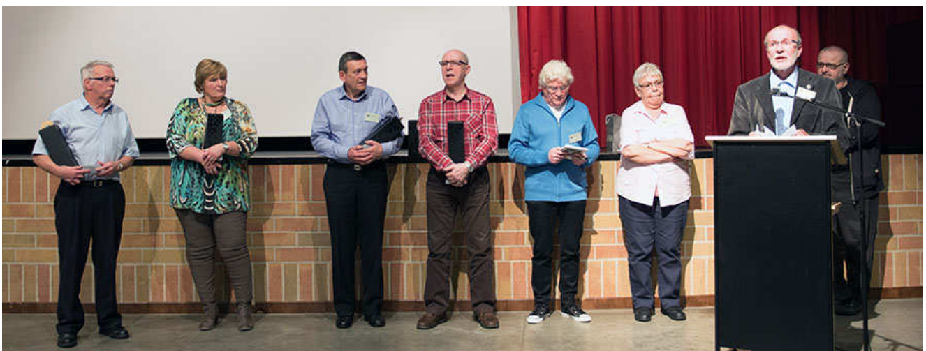
Jury en bestuur Wevac 58 ste Provinciale wedstrijd WEVAC in het GC De Bundel in Moorslede.