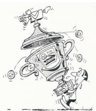
Tekening Abdon Van Bogaert