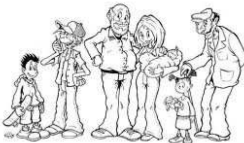
De Beverse Filmclub, één grote familie!

De kandidaturen dienen uiterlijk woensdag 7 september 2016 te 20.00 u. in het bezit te zijn van het secretariaat.