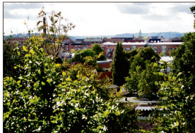
Udsigten ud over byen er flot året rundt - og arealet omkring det gamle sygehuskapel kunne udnyttes langt bedre, end det sker i dag, hvor området er domineret af p-pladser, mener arbejdsgruppen.