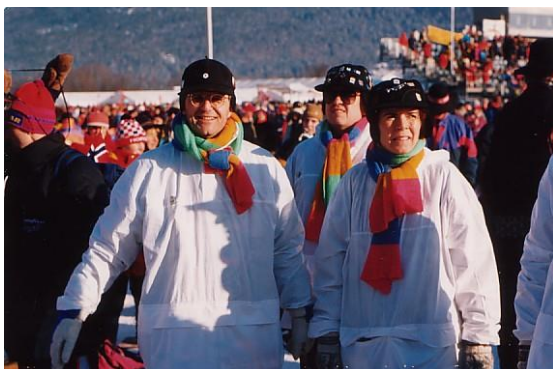
Det var godt å ha anorakk og farget skjerf!