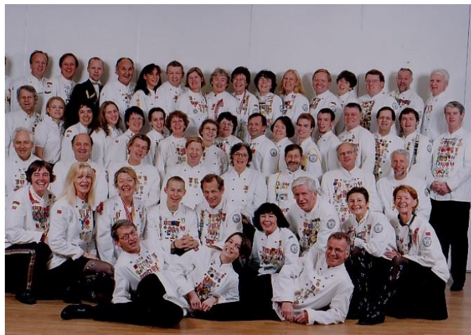
Stasen ved 10-årsjubileet