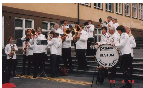
Festmusikk for avgangselevne på Ullern VGS