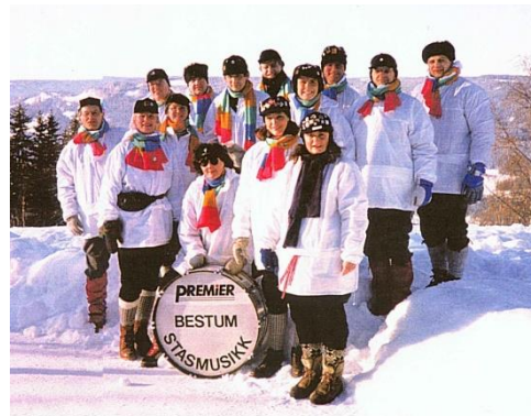
Mye vakkert på Lillehammer i 94