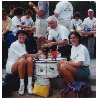
Lunsj på vei til VM