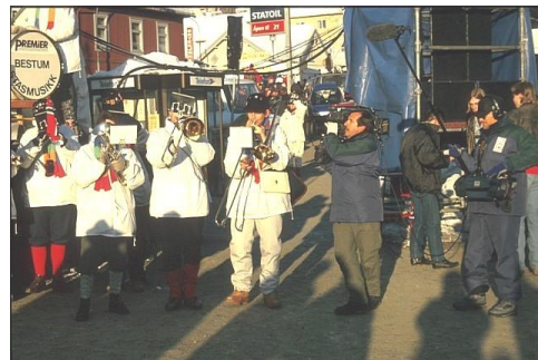
Internasjonal presse gjør "scoopet"