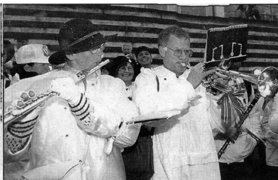
Nocturne går ut over eteren!

Full oppløsning, det er når alle fortegn plutselig er borte!