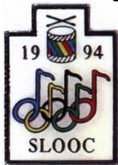
Stasens OL – pin

Ein dag utan speling er ein dag utan mening!