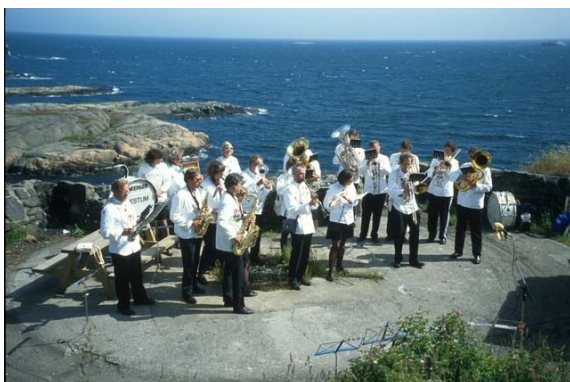
Ut mot havet i Arendal

De som har kort pust bør få korte noter!