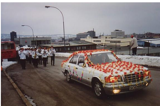
Bilkortesje med korps – bryllupsfeiring