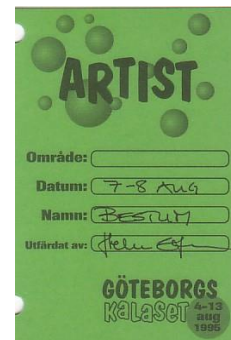
Akkreditert i Göteborg-VM