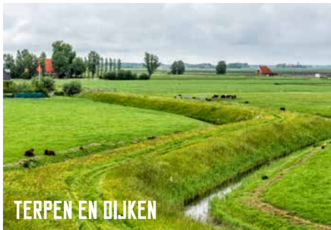
TERPEN EN DIJKEN

Laat je inspireren door de vergezichten over het prachtige open landschap. Laat je meewoeren door de waterwegen die authentieke dorpen doorkruisen. Ervaar de levendigheid van elfsteden stad Franeker. Ontdek de Waadhoeke vanaf het water en op de fiets met deze vaarroute en fietsknooppunten water inspiratiekaart.