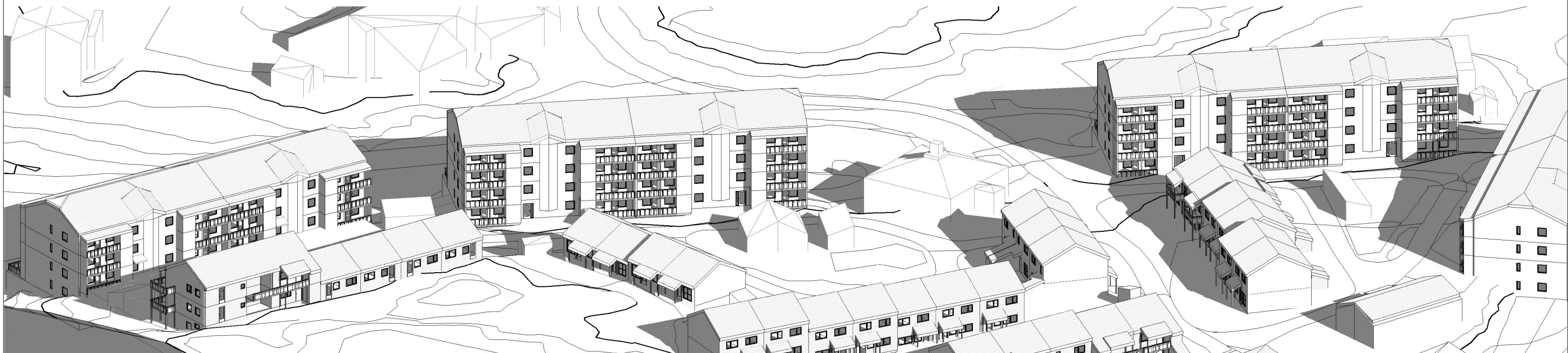
3D blokk 1.mai kl. 9.00