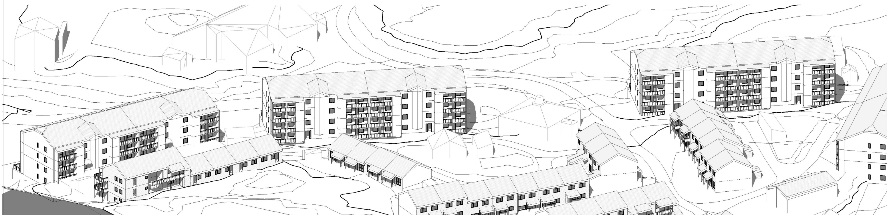
3D blokk 1.mai kl. 12.00