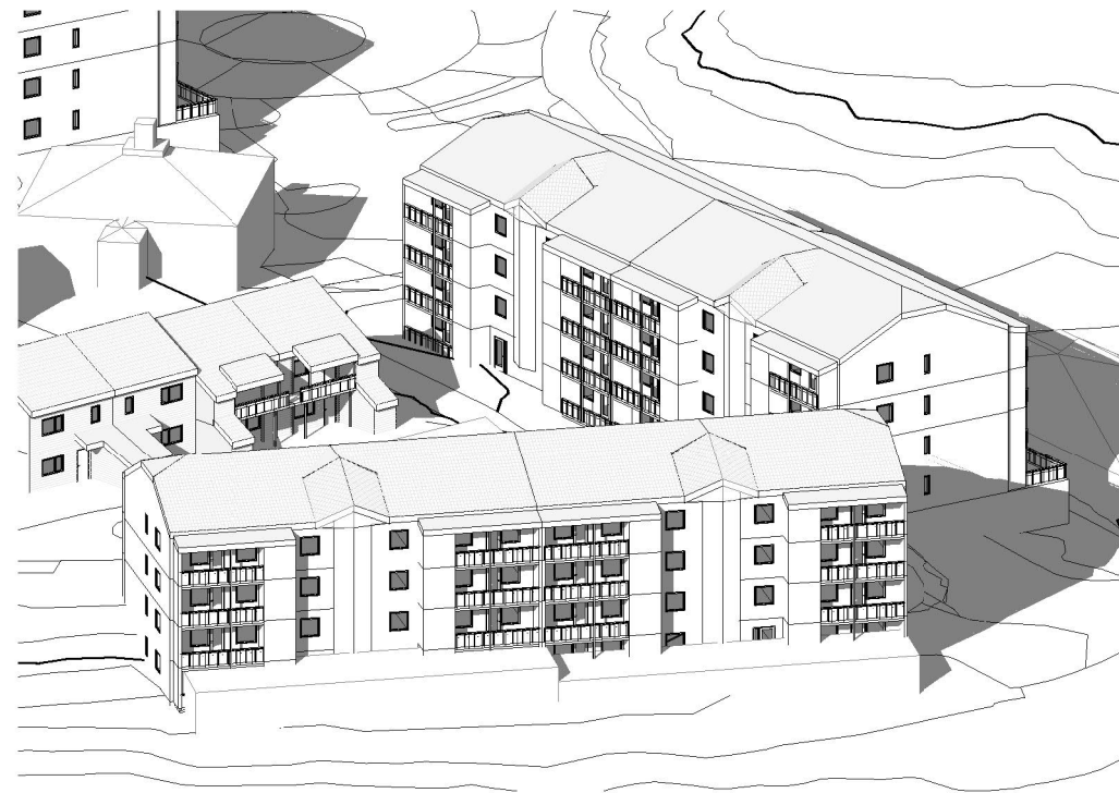
3D blokk 1. mai kl.9.00 nr2