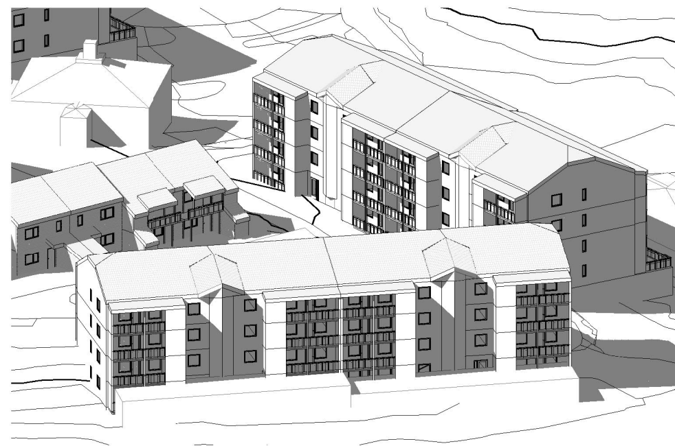
3D blokk 1. mai kl.12.00 nr2