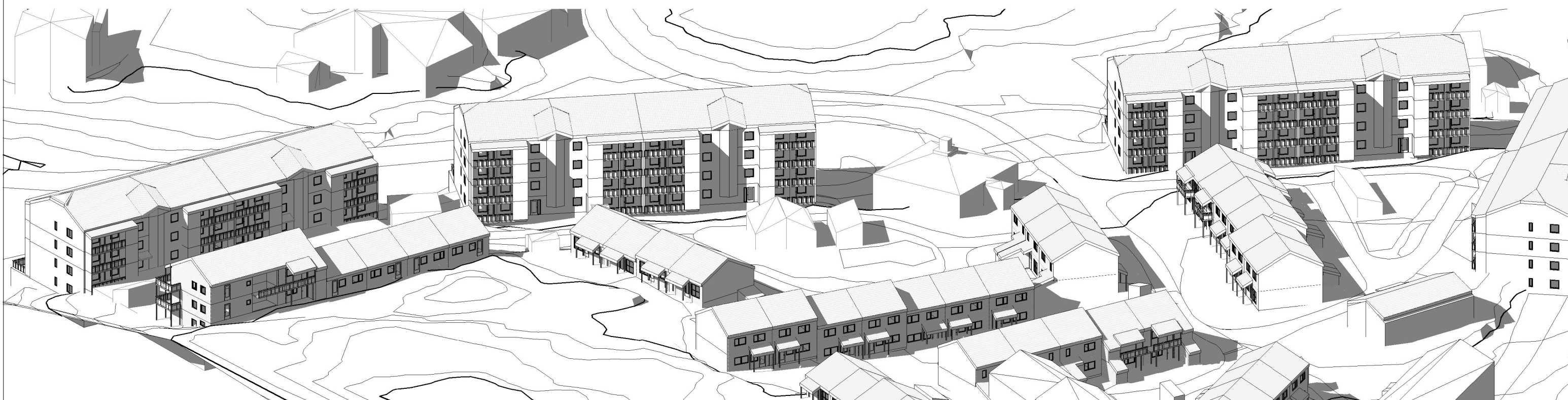
3D blokk 1.mai kl. 15.00