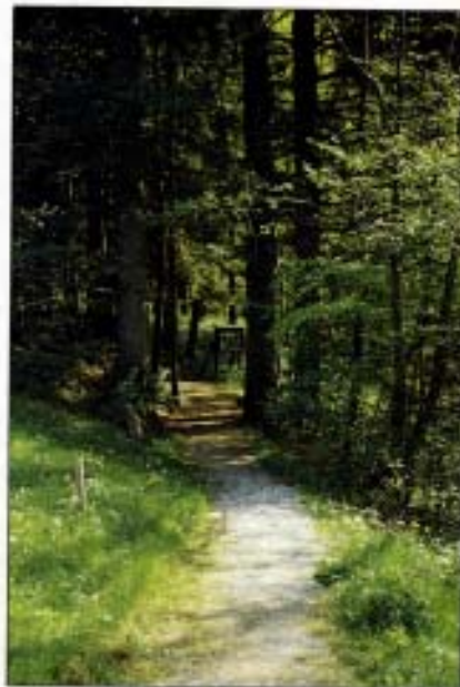
Abb. 8: Blick auf den Lehrpfad mit heimischen Gesteinsarten am Wegrand.

Erste öffentliche Anerkennung erfuhr unsere Arbeit 1987 mit der Verleihung des Umweltschutzpreises der Stadt Linz. Dies war für mich ein Impuls, in dieser Richtung weiterzuarbeiten. ÖKO-L 14/3 (1992)