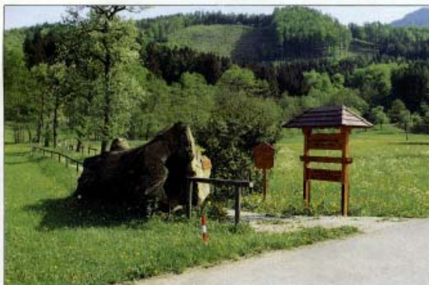
Abb. 2: Beginn des Naturlehrpfades mit 200jährigem Lindenstamm.

Nachdem der erste Tümpel fertiggestellt war, begann die Bepflanzungsarbeit. Wir mußten aber bald feststellen, daß nicht jeder Standort für jede Pflanze geeignet ist. Wir lernten schnell, uns vorher Ratschläge zu holen, wo welche Pflanze am besten gedeiht. Der kleine Garten, den wir in diesem Areal zusätzlich anlegten, wurde zu unserem Versuchsgelände. Manche Zwiebelpflanze fiel den Mäusen zum Opfer, andere Pflanzen vermehrten sich sehr schnell (z. B. Trollblume, Frühlingsknotenblume).