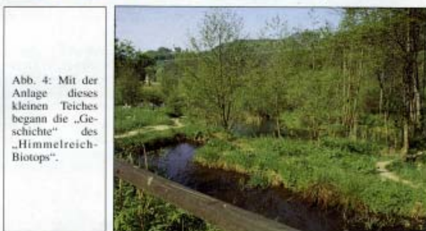
Abb. 4: Mit der Anlage dieses kleinen Teiches begann die „Geschichte“ des „Himmelreich-Biotops“.