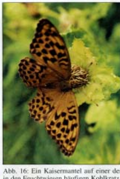
Abb. 16: Ein Kaisermantel auf einer der in den Feuchtwiesen häufigen Kohlkratzdisteln.

Pflanzenbestände (z. B. Baumaßnahmen) hier ein standortgerechtes Refugium finden könnten. Es geht auch darum, die im Rahmen meiner Mitarbeit in der Naturkundlichen Station neu gewonnenen Erfahrungen in die bestehende Konzeption einfließen zu lassen, die gesetzten Maßnahmen zu überprüfen und der Natur ihren Lauf zu lassen und nur sorg- und behutsam im notwendigsten Ausmaß einzugreifen. Das Informationsangebot wird