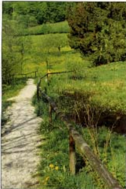
Abb. 7: Quellteich mit Fieberklee, Igelkolben, Gelber und Sibirischer Wasserschwertlilie.

Aus der näheren Umgebung holten wir uns verschiedene Pflanzen, die wir rund um unsere Teiche einsetzten. Im Sommer wurden wir für unsere Arbeit durch die Anwesenheit vieler Schmetterlinge, Libellen, Molche und sogar eines Feuersalamanders belohnt. Seit damals werden die Teiche und Tümpel jährlich von hunderten Grasfröschen, Erdkröten und auch vielen Gelbbauchunken zum