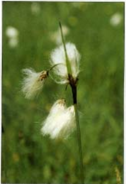
Abb. 10: Das Schmalblättrige Wollgras ( Eriophorum angustifolium HORNEM.), ein typischer Flach- und Quellmoorbewohner. In nächster Umgebung sind nur zwei weitere Standorte bekannt.

So konnte ein zirka 1200 Quadratmeter großer Teich mit einer Brutinsel, ein kleiner Quellteich, ein 500 Meter langer, geschotterter Wanderweg mit Rastbänken, sieben Schaukästen und Gesteinsdemonstrationen angelegt werden. Weiters wurden viele einheimische Pflanzen und Sträucher sowie einige Exemplare alter Obstbaumsorten (größtenteils beschildert) gesetzt; davon werden zirka 160 Pflanzenarten auf Fotos in den Schaukästen gezeigt. Im gesamten Areal wurden 60