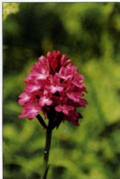
Abb. 14: Die Spitzorchis (Hundswurz – Anacamptis pyramidalis (L.)) kommt in diesem Gebiet sehr vereinzelt in Kalk-Magerrasen vor.

gesucht. Mit diesen Mitteln werden die entsprechenden Pflegemaßnahmen (selektive Mahd als Voraussetzung für die Ausreifung der Wiesenpflanzen) vorgenommen. Vier Landwirte des angrenzenden „Himmelreiches“ mit zusammen acht Hektar Feucht- und Bergwiesen beantragten – nach einem Informationsgespräch – ebenfalls Pflegeausgleichsmittel. Möglicherweise könnte sich auch die Funktion ergeben, daß lokal bedrohte