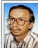
Werner BEJVL Naturk. Station der Stadt Linz Roseggerstraße 22 A-4020 Linz

Im südwestlichen Reil des Gemeindegebietes von Micheldorf, eingebettet in die Talsenke des Kremursprunges am Fuße der Kremsmauer, befindet sich das „Himmelreich-Biotop“ (Abb. 1). Der Name wurde vom anschließenden Höhenrücken, dem „Himmelreich“, abgeleitet. Auf einem zirka drei Hektar großen Areal im Besitz der Stadt Linz mit einem Erlen-Bruchwald sowie Quell-, Sumpf- und Bergwiesen wurden mehrere Teiche und Tümpel angelegt.