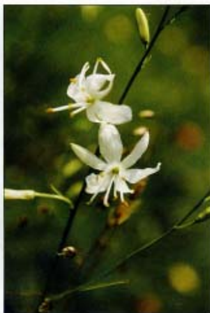
Abb. 15: Die Ästige Graslilie ( Anthericum vamosum ) kommt an Waldrändern, Böschungen und Magerrasen vor, im „Himmelreich“ an einer Stelle flächendeckend. Vgl. dazu auch Abb. 11.

Pflanzenbestände (z. B. Baumaßnahmen) hier ein standortgerechtes Refugium finden könnten. Es geht auch darum, die im Rahmen meiner Mitarbeit in der Naturkundlichen Station neu gewonnenen Erfahrungen in die bestehende Konzeption einfließen zu lassen, die gesetzten Maßnahmen zu überprüfen und der Natur ihren Lauf zu lassen und nur sorg- und behutsam im notwendigsten Ausmaß einzugreifen. Das Informationsangebot wird