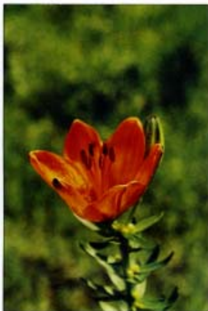
Abb. 13: Die Feuerlilie ( Lilium bulbiferum ) zählt zu den eindrucksvollsten Erscheinungen der Flora, wird aber in der weiteren Umgebung in den letzten Jahren zunehmend seltener.

gesucht. Mit diesen Mitteln werden die entsprechenden Pflegemaßnahmen (selektive Mahd als Voraussetzung für die Ausreifung der Wiesenpflanzen) vorgenommen. Vier Landwirte des angrenzenden „Himmelreiches“ mit zusammen acht Hektar Feucht- und Bergwiesen beantragten – nach einem Informationsgespräch – ebenfalls Pflegeausgleichsmittel. Möglicherweise könnte sich auch die Funktion ergeben, daß lokal bedrohte