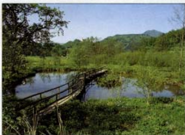
Abb. 5: Der mittlere Teich mit Sumpfwiese und Erlenbruchwald; im Hintergrund die Georgiberg-Kirche.