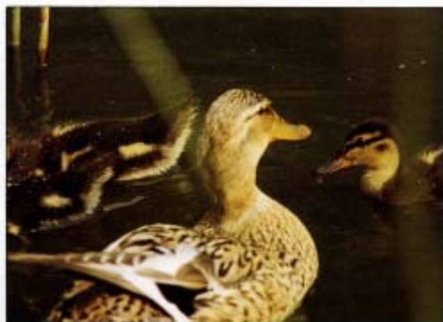
Abb. 3: Stockentenweibchen mit 14 Tage alten Jungtieren. Die Stockenten hätten sich auch ohne unsere Hilfe von selbst angesiedelt.

Alle Kinder waren von der Entenschar begeistert. Um die Enten nicht zu erschrecken, lernten sie rasch, leise zu sein. Die Kinder wußten auch bald sehr genau, nur die schmalen, bereits ausgetretenen Pfade zu benützen, um das hohe Gras und Schilf nicht niederzutreten. Sie beobachteten oft die Kaulquappen und kleinen Frösche und waren ganz begeistert, als die Seerosen die ersten Blüten trugen. Ganz von selbst wuchs das Interesse am Wechselspiel zwischen Lebensraum, Pflanzen und Tieren, aber es brachte auch die Erkenntnis, daß die Natur „grausam“ sein kann – als die Enten entdeckten, daß die Kaulquappen ein Leckerbissen sind. Auch das rätselhafte Verschwinden unserer Forellen klärte sich auf, als unser Nachbar, der oft am frühen Morgen Schwammerl suchte, zwei Graureiher entdeckte, die unsere Fische als willkommene Beute nutzten.