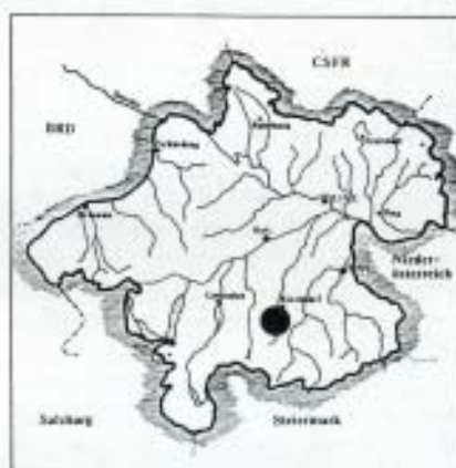
Abb. 1: Lage des „Himmelreich-Biotops“ im oberen Kremstal (Oberösterreich).

keine Einwände dagegen und wir begannen sofort mit den Aushubarbeiten. Mit großer Begeisterung schaufelten die Buben eine zirka zehn Quadratmeter große Grube und errichteten einen Damm. Dabei tauchten die ersten Probleme auf. Die Kinder konnten teilweise kaum mit den Werkzeugen umgehen und es ging natürlich einiges zu Bruch und manchmal endete der Gebrauch von Hammer und Krampen recht schmerzvoll.