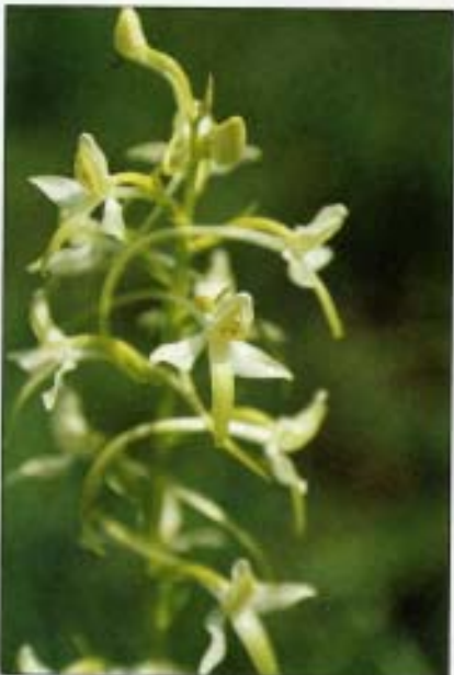
Abb. 9: Weiße Waldhyazinthe (Kuckucksstängel - Platanthera bifolia (L.)) zeigt wechselfeuchte Standorte an.

Da dieses Projekt im wesentlichen mehr Arbeit und auch finanzielle Mittel benötigte, mußte ich mich nach den nötigen Geldquellen und freiwilligen Arbeitskräften umsehen. Den Anfang erleichterte mir wiederum die Stadt Linz, weiters konnte ich auch den Micheldorf-Bürgermeister (der mir die Unterstützung des