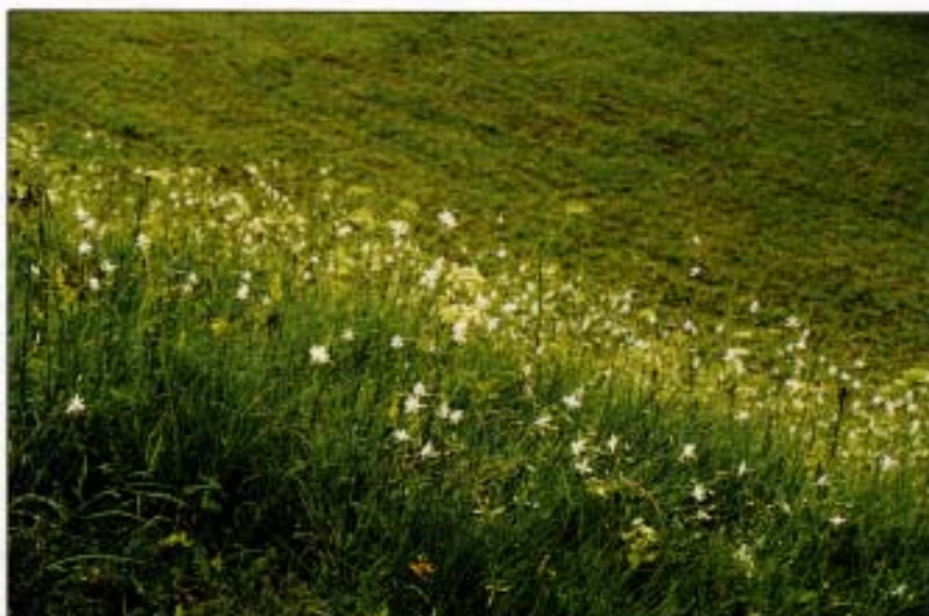
Abb. 11: Teilstück der Bergwiese im Himmelreich mit flächendeckender Ästiger Graslilie (Juli 1992).

Weinbergschnecke Wasserschnecken (unbest.)