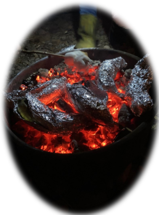
Grillning av banan med choklad, GOTT!

Den ser vi som ett bra rättesnöre att leva efter och sammanfattar på ett bra sätt hur vi bör vara mot varandra.