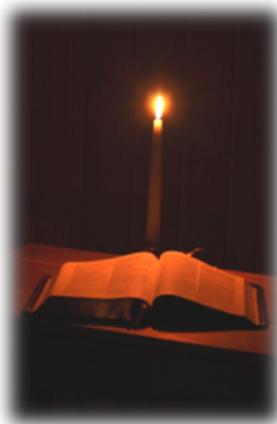
* Julevangeliet läser du i din bibel i Lukasevangeliet kapitel 2 och verserna 1–20.

Hur kan jag påstå något sådant? Kärnan i julens budskap är ju en enkel berättelse om ett spädbarn fött under enkla förhållanden – det framstår inte som något stort och avgörande. Men det är just där vi kan ta miste. Den början som skildras kan tyckas liten och obetydlig. Men det visade sig vara större än det verkade och berättelsen om Jesus Kristus fortsätter med stor uppståndelse och en världsvid rörelse, och slutar i triumf en gång. Det kan få bli en påminnelse till oss om att inte förakta en ringa begynnelse, även när det gäller tron i våra liv. Kanske har det fötts en tro – om än aldrig så liten – i ditt hjärta. Med lärdom i julens berättelse får du ta vara på denna tro som en enkel början men med potential att växa sig större.