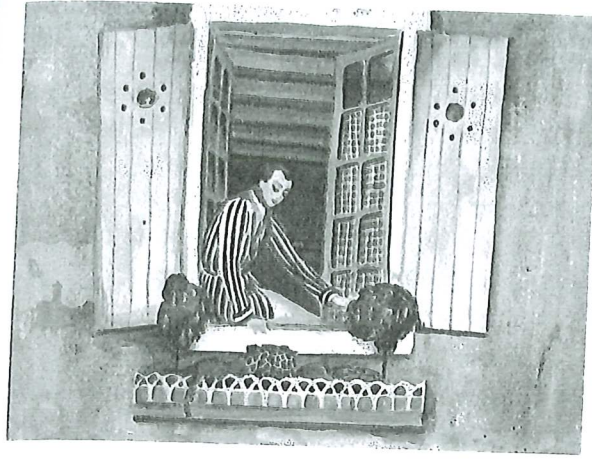
"Kvinden i vinduet". Gengives med tilladelse fra Vejle Kunstmuseum. Reproduceret på forsiden af udstil- lingskatalog: "Kvin- den i vinduet" – en showcase om Einar Wegener og Lili Elbe. 2016".

i en fransk provins. "En vis stilisering og dekorativ virkning præger disse malerier, der ofte tillige har en særegen lysvirkning", står der hos Weilbach . Her nævnes også, at han relativt tidligt engagerede sig i hustruens karriere og nedtonede sin egen virksomhed. Han malede baggrunde og staffage på hendes malerier og stillede op som model for hendes kvindeskikkelser. W. var uddannet som malersvend, havde gået på Vejle Tekniske Skole og gik på Kunstakademiet i København 1902-04. Kunstmuseet Arken i Ishøj havde i 2015-2016 en stor udstilling med både Einar og Gerda Wegeners værker, selvom det var Gerda, som var hovedpersonen. 9 Vejlemuseerne, som har nogle af W.s værker, havde til gengæld fokus på ham på en udstilling i 2016. I kataloget karakteriseres han som en ikke specielt god kunstner om end hans værker er ganske hæderligt udført. 10