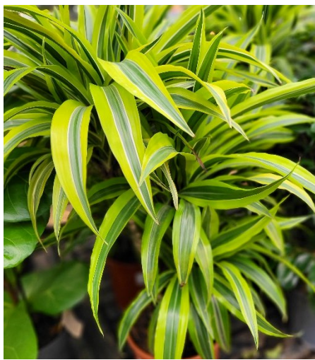
Draketre/Dracaena ( Dracaena fragrans ) Draketrefamilien (Dracaenaceae)

Allergivennlig, men giftig (duftoverfølsomme kan reagere).