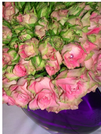
Roser uten duft ( Rosa ) Rosefamilien (Rosaceae)