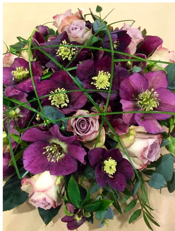
Paskerosen / Påseklokken ( Helleborus orientalis )

Planten kan også stå ute i noen minusgrader (minus 5-6 grader) og noen steder i landet kan den overvintre i hagen.