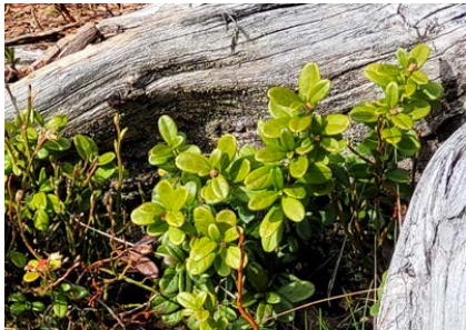
Blåbærlyng ( Vaccinium myrtillus ) og tyttebærlyng ( Vaccinium vitis-idaea ) Lyngfamilien (Ericaceae)