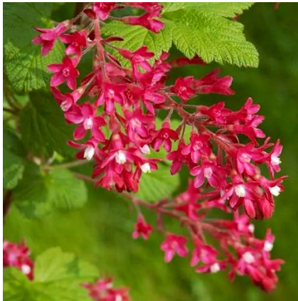
Blodfarget rips ( Ribes sanguineum ) Ripsfamilien (Grossulariaceae)