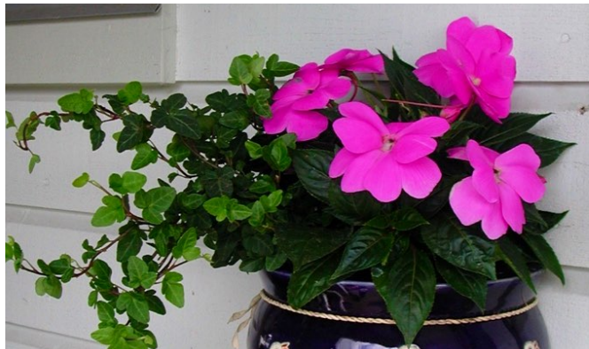
Flittig lise ( Impatiens walleriana ) Springfrøfamilien (Balsaminaceae)