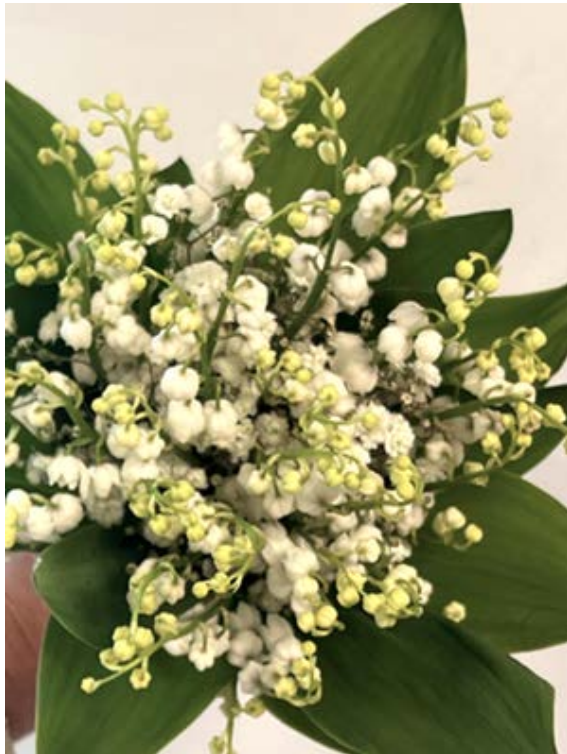
Liljekonvall ( Convallaria majalis )

Asparagesfamilien (Asparagaceae), tidligere egen familie.