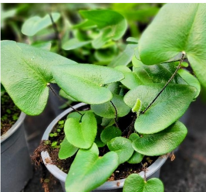
Bregne ( Hemionitis arifolia ) Plantefamilie (Pteridaceae)