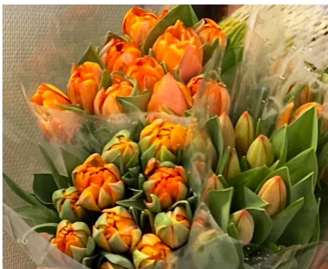
Tulipaner ( Tulipa ) Liljefamilien (Liliaceae)

Blomstene er i utgangspunktet allergivennlige, men flere av løkblomstene har en sterk duft som duftoverfølsomme kan reagere på.