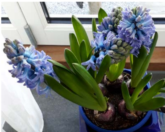
Svibel, hyasint ( Hyacinthus orientalis )