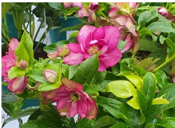
Paskeroser / Påseklokker ( Helleborus orientalis ) Soleiefamilien (Ranunculaceae)

Allergivegnlig. Meget giftig ved spising!!