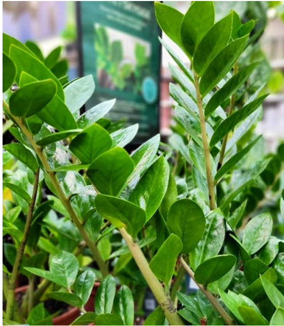
Zamiokulkas / Smaragdpalme / Lykkebregne ( Zamioculcas zamiifolia ) Myrkonglefamilien (Araceae)