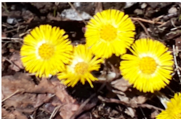
Hestehov ( Tussilago farfara ) Kurvplantefamilien (Asteraceae) Har vært brukt i folkemedisinen, men er klassifisert som svakt giftig.

Vi forstår at barn synes det er fristende å plukke hestehoven for å ta med hjem.