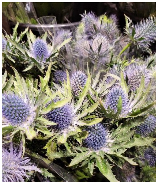
Alpestikke ( Eryngium alpinum ) Big blue Skjermplantefamilien (Apiaceae)

Allergivennlig, men giftig Strandhede/Ramfjord: Alle plantedeler hos akeleie inneholder en mengde giftig celledsaft Giftinformasjonen: Akeleie ( Aquilegia ) er en lite giftig plante, og forgiftning etter inntak er ikke kjent. Uhellsinntak trenger derfor ingen oppfølging.