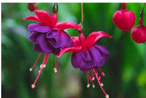
Fuksia ( Fuchsia ) Mjølkefamilien (Onagraceae)