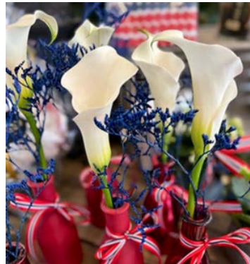
Kalla ( Calla ) Myrkonglefamilien (Araceae)