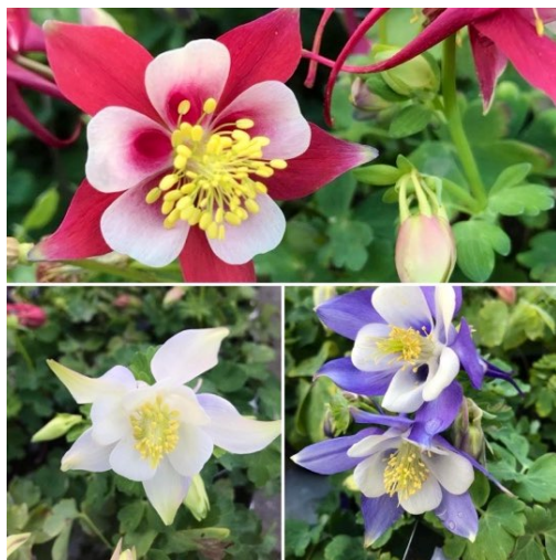
Akeleie ( Aquilegia vulgaris ) Soleiefamilien (Ranunculaceae)

Planter som er allergivennlige, men mer eller mindre giftige, må plasseres utenfor barns rekkevidde.