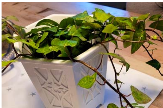
Eføy, bergflette ( Hedera helix ) Bergflettefamilien (Araliaceae)

Allergivennlig. Ikke giftig. (Beskrevet som giftig for katter).