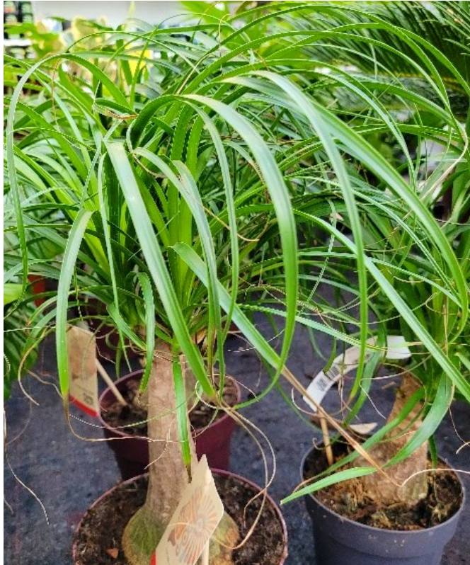
Elefantfot ( Beaucarnea recurvata ) Aspargesfamilien (Asparagaceae)