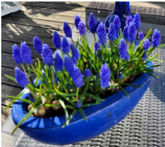
Perleblomst ( Muscari ) Aspargesfamilien (Asparagaceae)

Blomstene er i utgangspunktet allergivennlige, men som flere av løkblomstene har de en sterk duft som duftoverfølsomme kan reagere på.