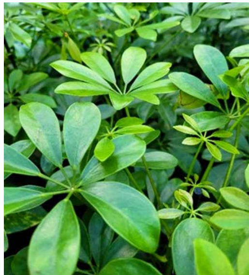
Paraplyplante ( Schefflera ) Bergflettefamilien (Araliaceae)

Allergivegnlig. Giftig og hudiriterende.