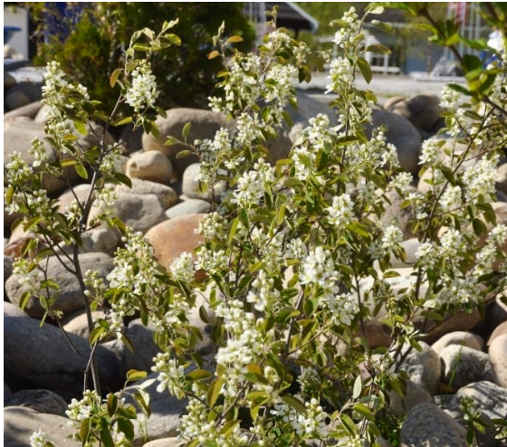
Grener av Mispel ( Cotoneaster ) Rosefamilien (Rosaceae)