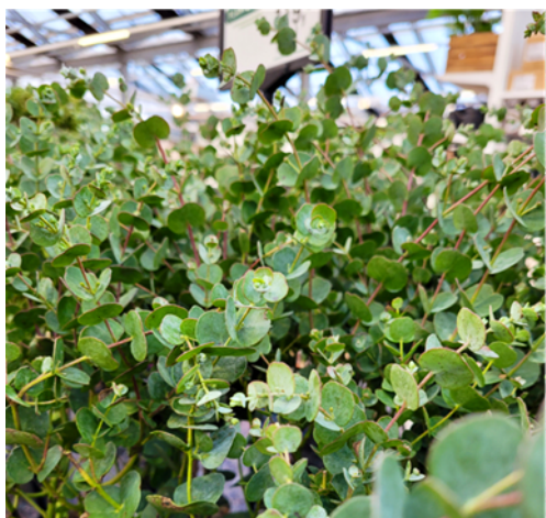
Eukalyptus ( Eucalyptus ) Duften kan utløse reaksjoner for duftoverfølsomme. Eukalyptusslekten er en planteslekt i Myrtefamilien Anbefales ikke inne.

Overfølsomhet for plantedufter er ganske vanlig. Det er viktig å vite at en slik overfølsomhet kan eksistere uten at en er allergisk. Hos en allergiker er toleransen ofte nedsatt, og symptomene melder seg ved lavere konsentrasjoner av duftstoffer. Følgende vårbloster som har mer eller mindre intens duft, må brukes med forsiktighet inne hos allergikere og duftoverfølsomme.