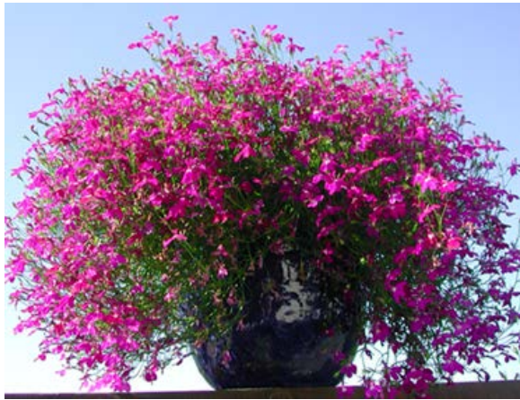
Lobelia ( Lobelia ) Botnegrasfamilien (Lobeliaceae)