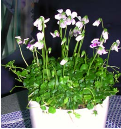
Australsk fiol ( Viola hederacea ) Fiolfamilien (Violaceae)

Denne fiolen kan stå både inne og flyttes ut om sommeren, men tåler ikke frost. Den kommer raskt med utløpere, og er en vakker allergivegnlig blomst.