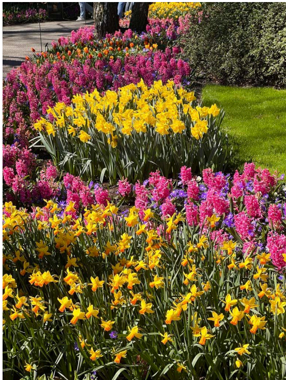
Omfatter bl.a. påskeliljer, tulipaner, liljer, perleblomst, rutelilje, krokus, pinseliljer, svibel, skilla og iris

Løkplanter kan være sterkt duftende og især løkene er giftige. Ved skjæring avgir de ofte saft som kan medføre hudirritasjon og allergi ved hyppig håndtering.