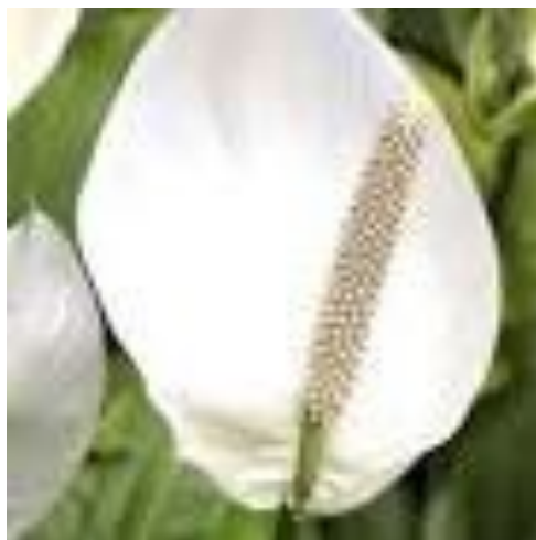
Fredslilje ( Spathiphyllum wallisii ) Myrkonglefamilien (Araceae) Plantesaften er lett hudirriterende og kan en sjelden gang gi en allergisk reaksjon.