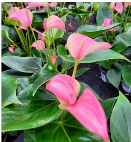
Flamingo ( Anthurium andreaeanum ) Myrkonglefamilien (Araceae)

Hele planten er hud- og slimhinneirriterende. Unngå direkte kontakt med bladene. Gjentatt kontakt med plantesaften kan medføre allergisk hudreaksjon. Ingen pollenproblemer med planten, som både kan være inne og være ute til frosten kommer.