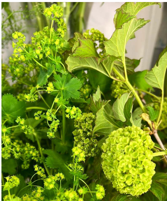
Marikåpe ( Alchemilla ) Rosefamilien (Rosaceae).

(Giftig bare når den spises i større mengder).