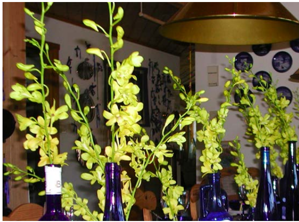
Orkidéer Orkidéfamilien (Orchicaceae)

Orkideer gir ikke allergi, men noen arter avgir en del duft: