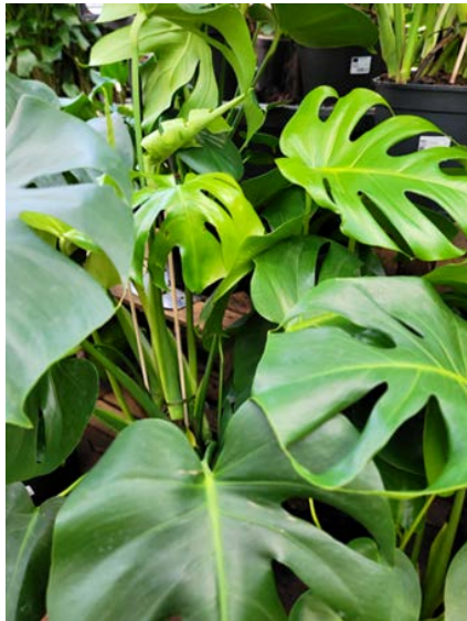
Monstera ( Monstera deliciosa ) Myrkonglefamilien (Araceae)

Allergivegnlig. Giftig og hudiriterende.