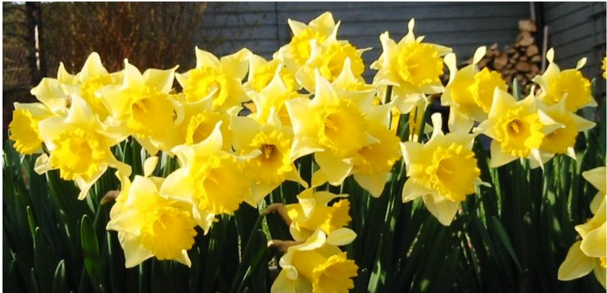
Påskelilje ( Narcissus pseudonarcissus ) Påskeliljefamilien (Amaryllidaceae)

Blomstene er i utgangspunktet allergivennlige, men har ofte en duft som duftoverfølsomme kan reagere på.