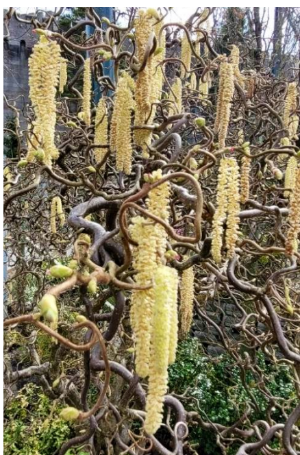
Hassel ( Corylus avellana )