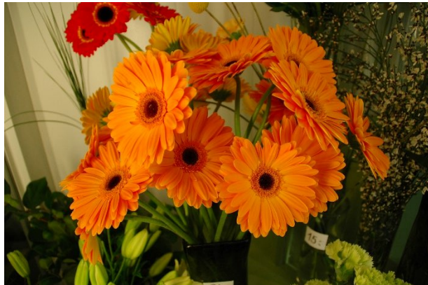
Gerbera ( Gerbera ) Kurvplantefamilien (Asteraceae)