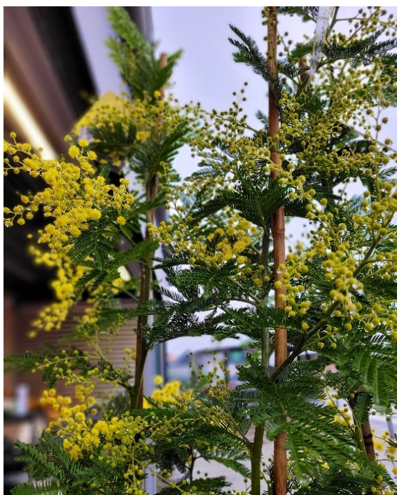
Mimosa ( Mimosa pudica )