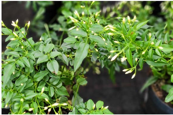
Jasmin ( Jasminum poly )