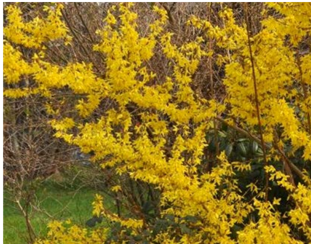
Gullbusk ( Forsythia ) Oljetrefamilien (Oleaceae)

Denne og andre Kurvplanter anbefales ikke inne for allergikere. Enkelte kan reagere med allergilignende plager eller reagere på duften.