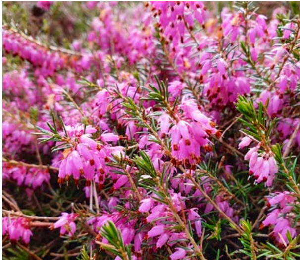
Vårlyng ( Erica carnea ) Lyngfamilien (Ericaceae)

NB Opiumsvalmue er giftig ( Papaver somniferum ).