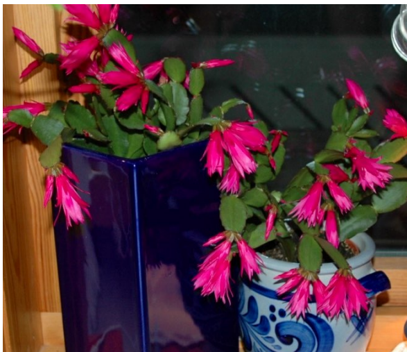
Påskeekaktus ( Hatiora gaertneri )

De fleste orkideer som selges i Norge er ikke giftige. Se også Wanda.