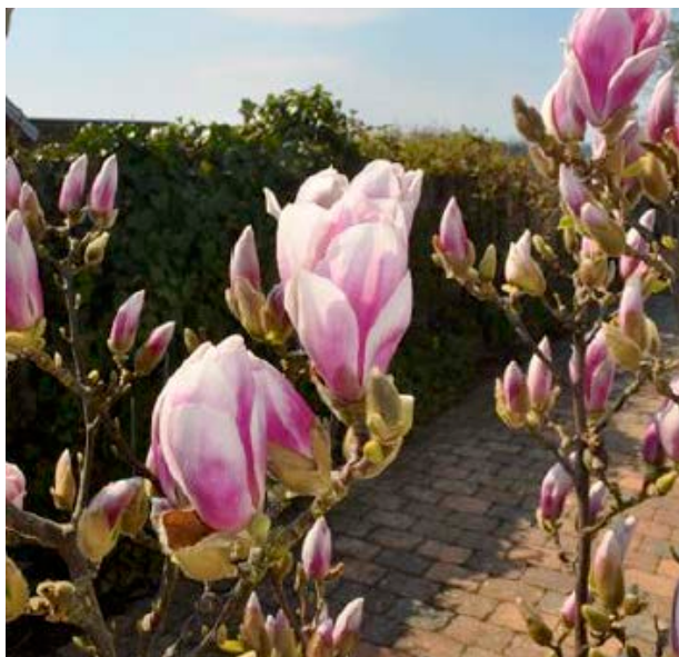
Magnolia ( Magnolia ) Magnoliafamilien (Magnoliaceae)

Ved å være varsom og passe på at hestehov ikke spises, må vi kunne si at barn må kunne plukke denne vårgleden til sin mamma/pappa eller sine besteforeldre.