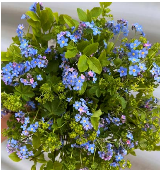
Forglemmegei ( Myosotis ) Rubladfamilien (Boraginaceae)