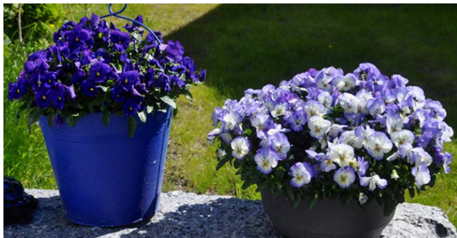
Fioler ( Viola ) og Stemor ( V. tricolor ) Hornfiol ( V. cornuta ) Fiolfamilien (Violaceae)