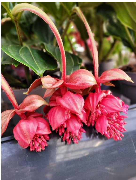
Medinilla / Rosenskjerm, Praktmedinilla ( Medinilla magnifica ) Plantefamilien (Melastomataceae)

Her er marikåpe sammen med en Viburnum opulus var. Roseum .