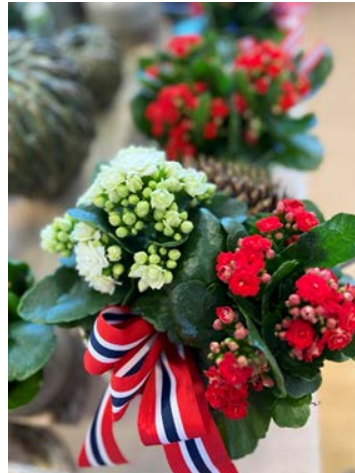
Ildtopp ( Kalanchoë ) Bergknappfamilien (Crassulaceae)

Blomstene er allergivegnlige og duftfrie.