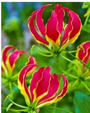
Klatrelilje ( Gloriosa superba ) Tidløsfamilien (Colchicaceae)