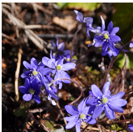
Hvitveis ( Anemone nemorosa ) og blåveis ( Hepatica nobilis ) Soleiefamilien (Ranunculaceae) Giftige og med duft. Anbefales ikke å ta med inn.