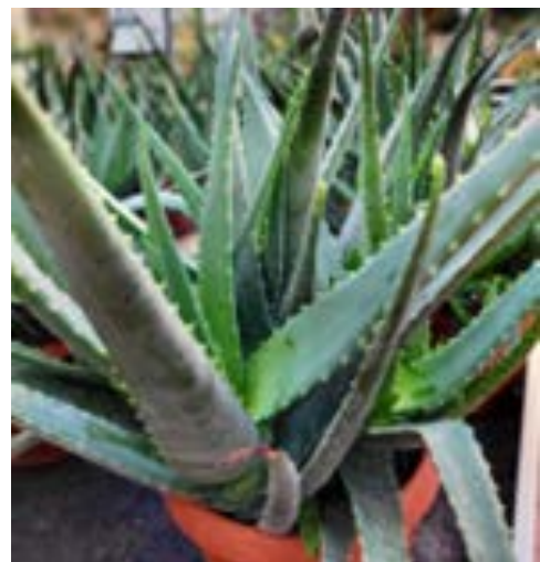
Aloe Vera Aloefamilien (Asphodelaceae) Allergivennlig. (Enkelte andre aloe-arter, som bitter aloe er giftige).