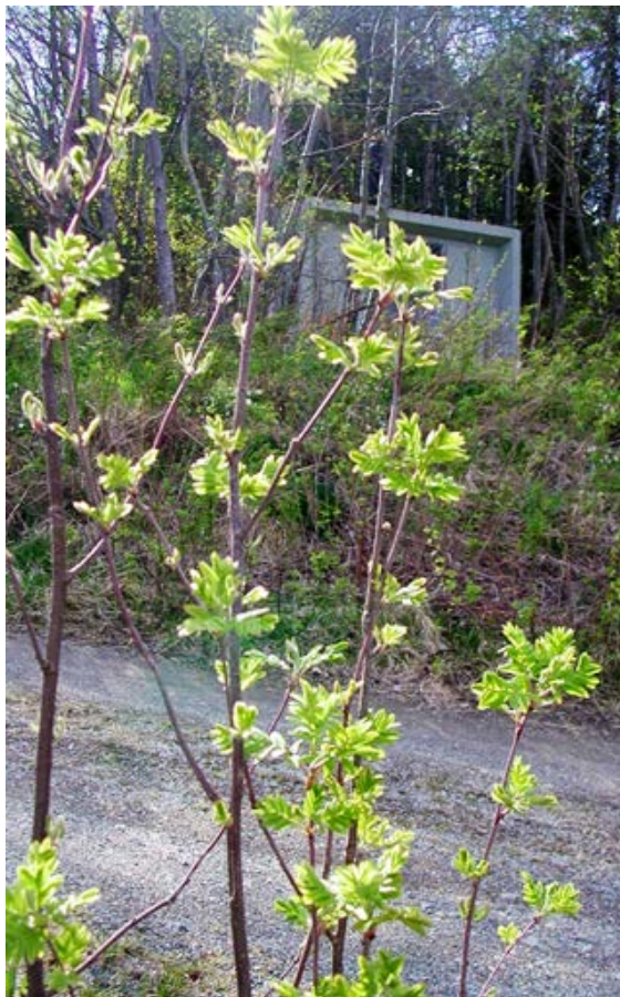
Grener av Rogn ( Sorbus aucuparia ) Rosefamilien (Rosaceae)