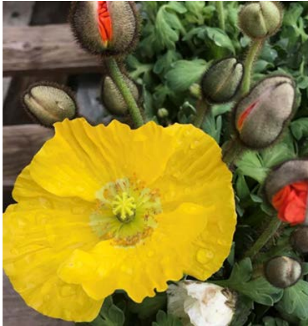
Valmue ( Papaver ) Valmuefamilien (Papaveraceae)