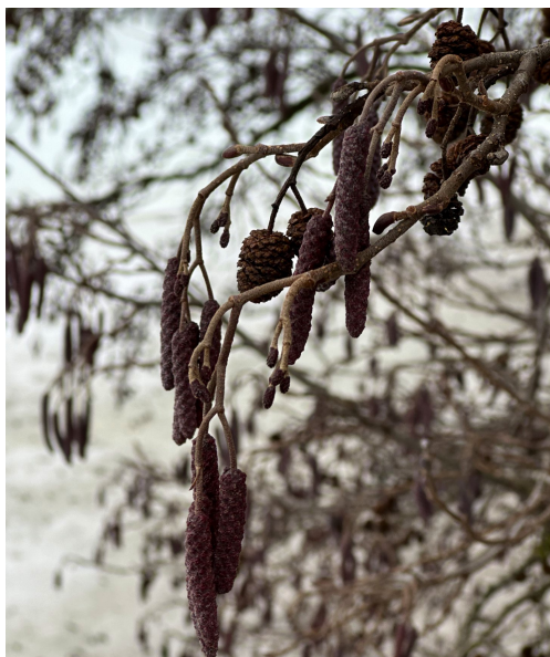
Or ( Alnus ) Bjørkefamilien (Betulaceae)