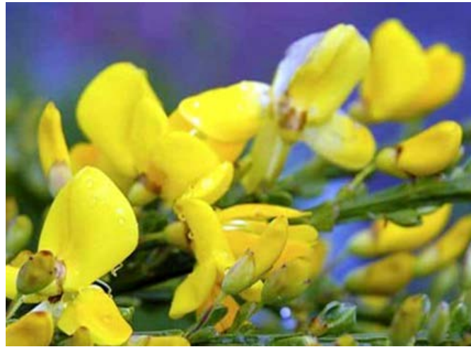
Gyvel ( Cytisus scoparius ) Erteblomstfamilien (Fabaceae)

Allergivegnlig, men det kan være giftige arter (se Gift-informasjonen).