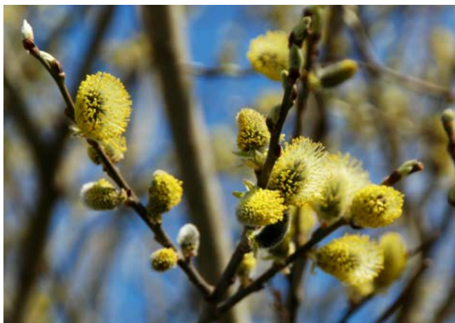
Selje ( Salix )

Selje, hassel, or og bjørk gir stor risiko for pollenallergi i pollensesongen for den enkelte tresort. Vi anbefaler å ikke ta inn grener med rakler av disse treslagene for dekorasjon eller spiring, hverken i private eller offentlige miljøer.