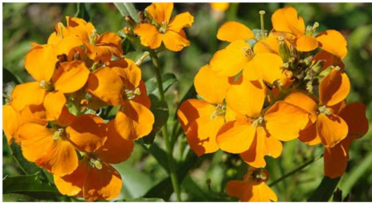
Gyllenlakk ( Erysimum cheri ) Korsblomstfamilien (Brassicaceae)

Allergivegnlig, hudirriterende og giftig.