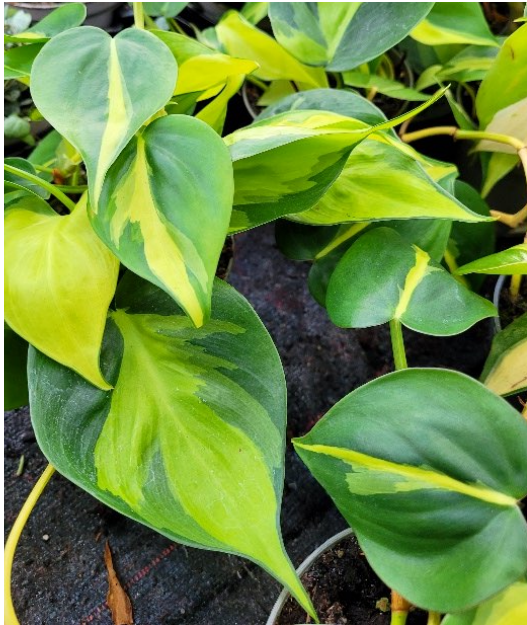
Gullranke ( Epipremnum aureum ) Myrkonglefamilien (Araceae)

Allergivegnlig, men det kan være giftige arter (se Gift-informasjonen).