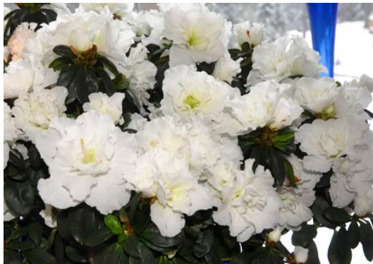
Alperose/Asalia/ Azalea ( Rhododendron ) Lyngfamilien (Ericaceae).

Allergivennlig, men giftig (duftoverfølsomme kan reagere).