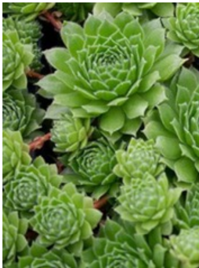
Takløk ( Sempervivum ) (ligner litt på Echeveria )

Inneholder giftstoffer (saponiner) som kan med- føre forgiftning hos kjæle- dyr. Forgiftning hos mennesker er ikke kjent. (Giftinformasjonen).