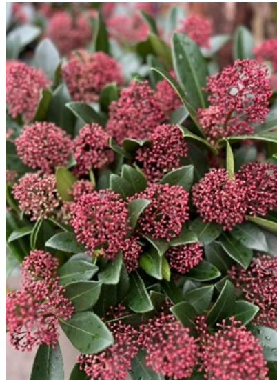
Vinterbær ( Skimmia japonica )

Ingen kjente helseproblemer med denne arten.