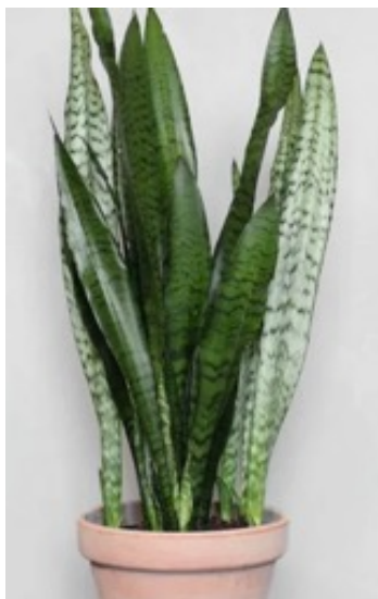
Svigmors tunge ( Sansevieria trifasciata )