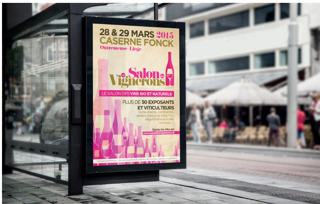
IMAGE DE MARQUE GÉNÉRALE COMMUNICATION ÉVÉNEMENTIELLE