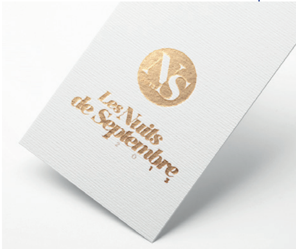
IMAGE DE MARQUE GÉNÉRALE COMMUNICATION ÉVÉNEMENTIELLE