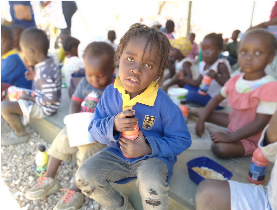
Lunchen in de schaduw