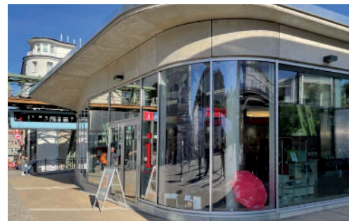
Der Pavillon der Wuppertal Touristik, in der Nähe des Hauptbahnhofs in Elberfeld

Anreise Das Schwebodrom befindet sich am Werth 96 im Herzen der Innenstadt von Wuppertal-Barmen.