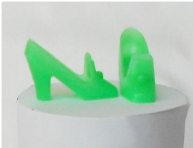
Chunky el. pilgrims