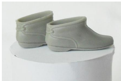
Go-Go Boots (mjuka)