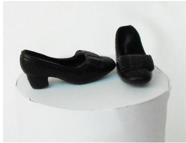
Bow shoes (mjuka)