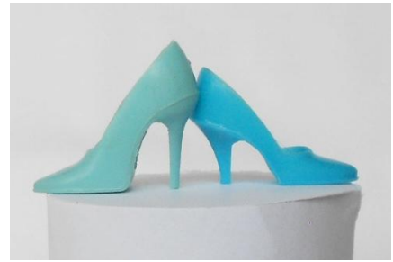
Skillnaden mellan de två