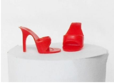
OT (Open Toe) vänsterskon märkt med Japan

På Forumet kommer det att finnas listor i vilka färger och vilken sko som hörde till vilken Barbie dress.