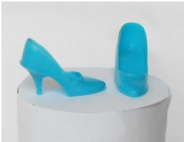
CT (Close Toe)