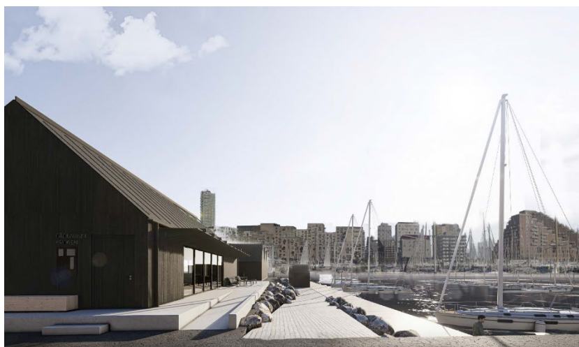
Prospekt af det nye klubhus med kig mod øst. Illustration Sølvesten Arkitektur.