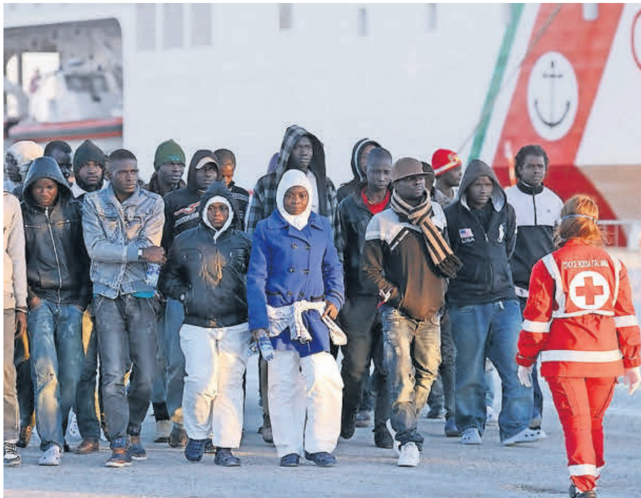
PROBLEMI Vi sono stati episodi di malagestione di fondi italiani e fondi UE per l'accoglienza dei migranti giunti in Italia.

Di fronte ai rischi terrorismo e criminalità si ricorre alle videosorveglianza o alle intercettazioni telefoniche. Dobbiamo accettare una minor privacy per avere in cambio una maggiore sicurezza? «Il terrorismo e la grande criminalità sollecitano sempre gli Stati a introdurre misure di contrasto che limitano diritti e libertà fondamentali sia delle potenziali