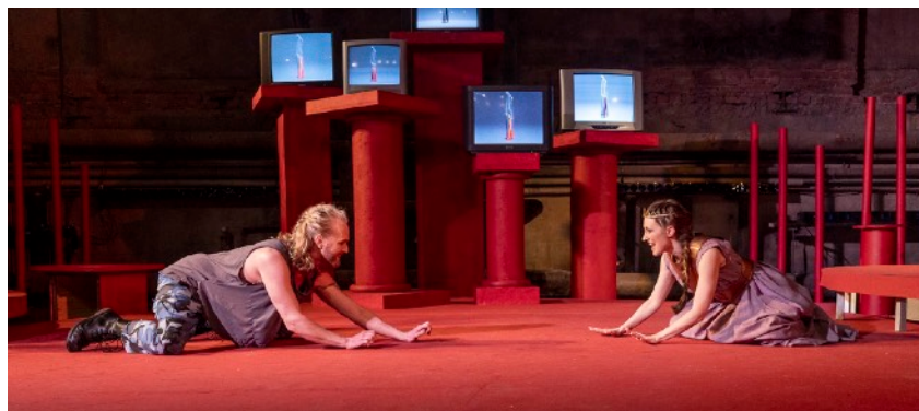
Västalen 2023, foto Maximillian Mellfors

2008 - 2013 konstnärlig ledare för PUMA scenkonst.