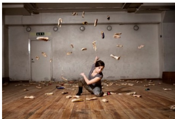
GISELLE REVISITED 2016, foto Jonas Jörneberg