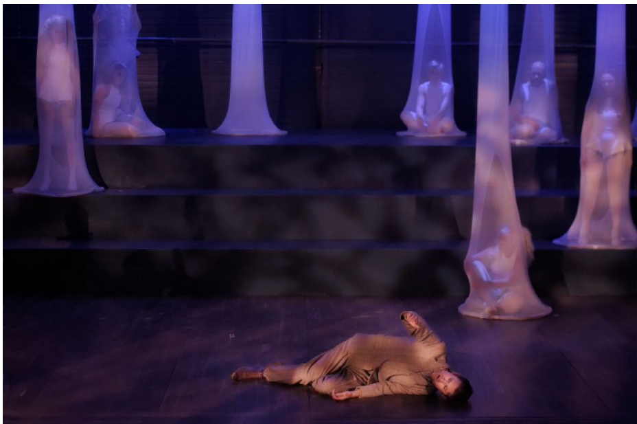
HÁXORNA 2016

Jag är född 1981 och i grunden utbildad balettdansare på Kungliga Svenska balettskolan i Stockholm. Jag har frilansat inom scenkonst i 20 års tid inom olika discipliner och sammanhang, och under de senaste 10 åren framför allt varit verksam som regissör, performer och dramatiker. Jag arbetar ofta med utgångspunkt i samskapande, i en kombination av ett rörelsebaserat och textbaserat formspråk, gärna med inslag av rörlig bild och/eller livemusik. Utöver min konstnärliga praktik är jag utbildad behandlingsassistent med inriktning på missbruk och psykisk ohälsa.