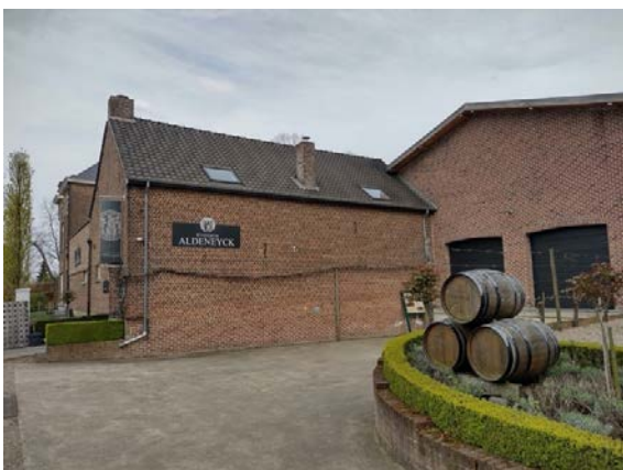
Een bezoek aan Aldeneyck loont zeker de moeite!

Net voor Aldeneik draai je aan KP 25 af naar links, richting KP 27. Tenzij je een wijnliefhebber bent... Volg in dat geval even KP 24 tot aan het Wijndomein Aldeneyck. Ze zijn hier wat fier op hun pinot-wijngaarden, de meest noordelijk gelegen van Europa. Het warme microklimaat van de regio en de unieke stenige bodem zorgen voor wijnen met een mineralige, elegante en fruitige smaak ( www.wijndomein-aldeneyck.be ). Maak daarna rechtsomkeer.