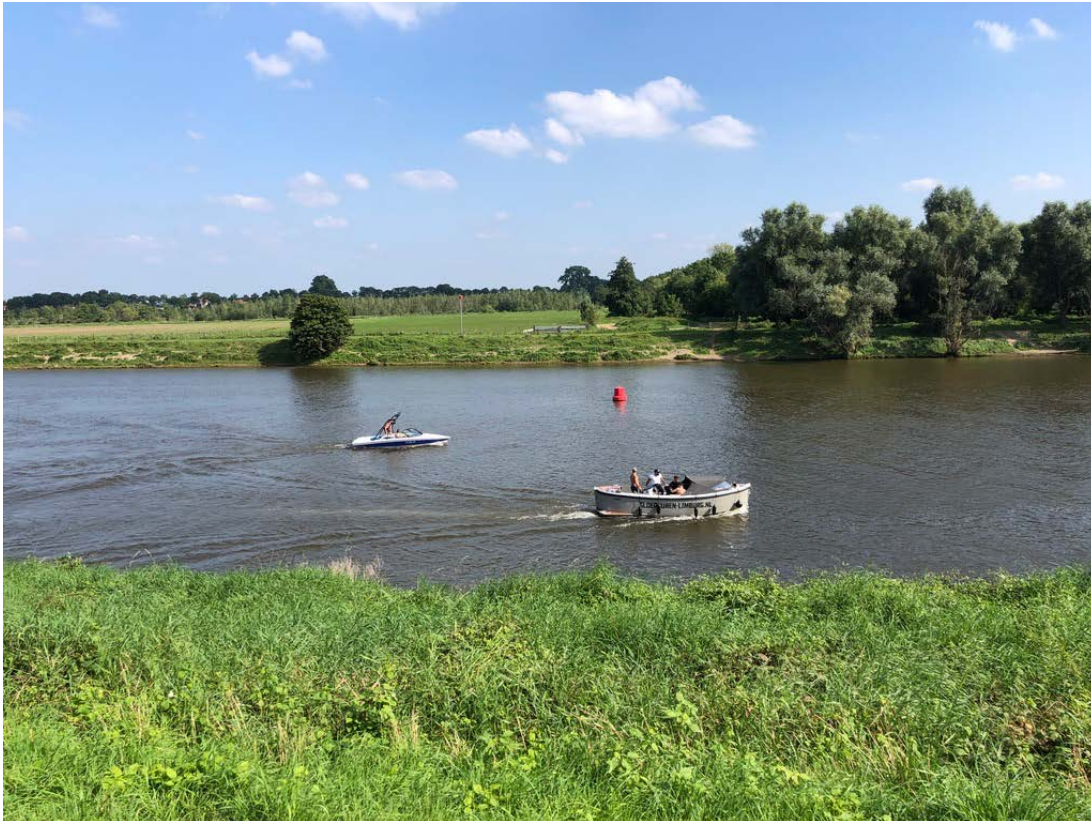
Stilleven langs de oevers van de Maas