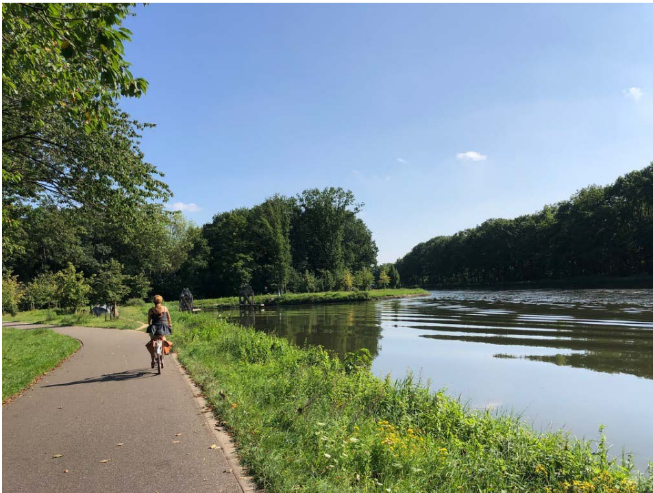
Ontspannen fietsen langs de Zuid-Willemsvaart

Au Nom de Dieu is het ideale vertrekpunt voor een onvergetelijke fietstocht. Je start met de rug naar de kerk. Net na het grote plein ga je rechts op de Groenstraat. Aan de Zuid Willemsvaart ga je links. Je bent meteen op het fietsknooppuntennetwerk aangekomen. Deze waterloop tussen Maastricht en 's Hertogenbosch is genoemd naar koning Willem I, koning der Verenigde Nederlanden. Hij wilde het Luikse industriebekken en de Noord-Nederlandse handelssteden met elkaar verbinden en zo een alternatief bieden voor de Maas. De graafwerken over het 123 km lange traject tussen Maastricht en 's Hertogenbosch duurden drie jaar en kostten 4,5 miljoen gulden. Zo'n 40 km van het kanaal loopt op Belgisch grondgebied. In 1826 konden de eerste vrachtschepen varen. Je fietst bijna 5 km op het jaagpad van het kanaal.