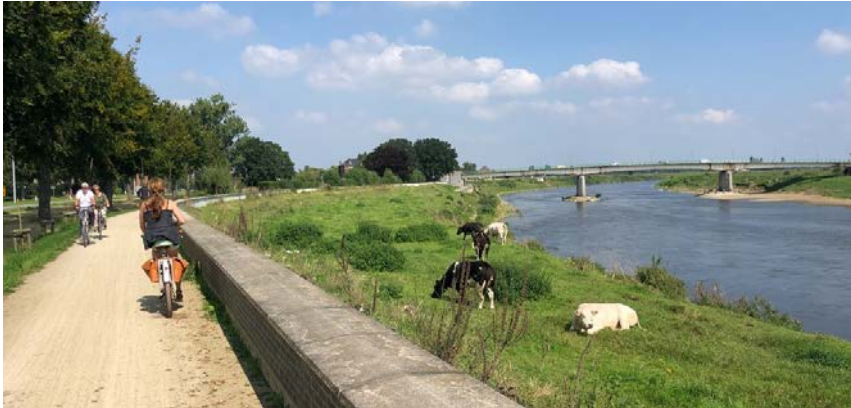
Op naar de Brug van Maaseik