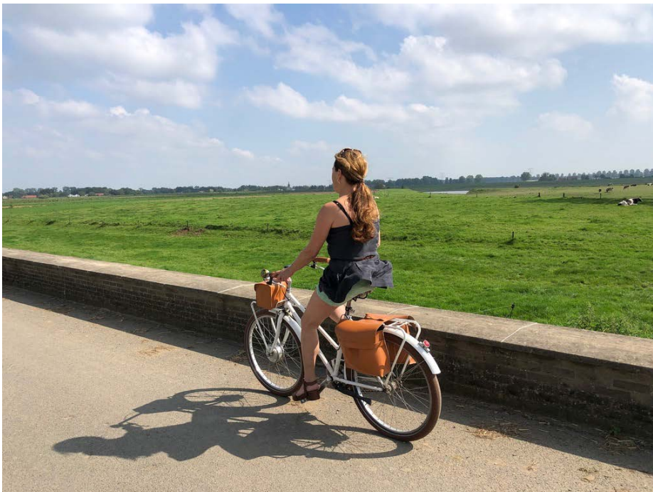
Heerlijk fietsen door de Maasvallei

Ook na De Wissen volgt er een stukje natuurpracht. Je fietst onbekommerd op autovrije wegen, nu eens langs langs de meanderende Maas, dan weer langs een van de Maasplassen. De Bichterweerd bijvoorbeeld is een echt paradijs voor steltlopers en vogels zoals de roodborst en de veldleeuwrik. Net voor KP 26 passeer je aan de Sint-Geertrui kerk van Heppeneert. Ook nu nog komen er bedevaarders langs. Ze aanbidden het beeld van de OLV van Rust, een Mariabeeld dat in de 16 e eeuw vervaardigd werd en op wonderbaarlijke wijze zou zijn aangespoeld na een overstroming van de Maas. In 1801 kreeg het zijn huidige plek in de St.-Gertrudiskerk. In de bedevaartswinkel kun je religieuze voorwerpen en kaarsen kopen.