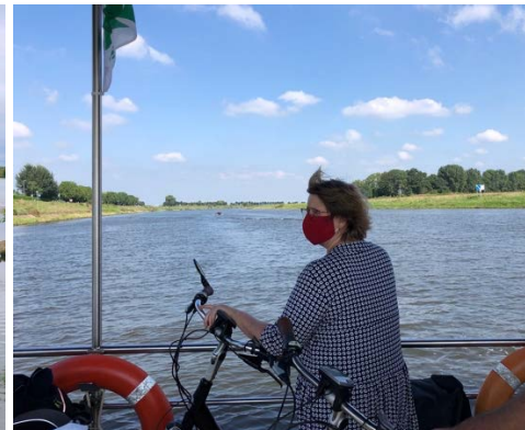
Een rustgevend pontje