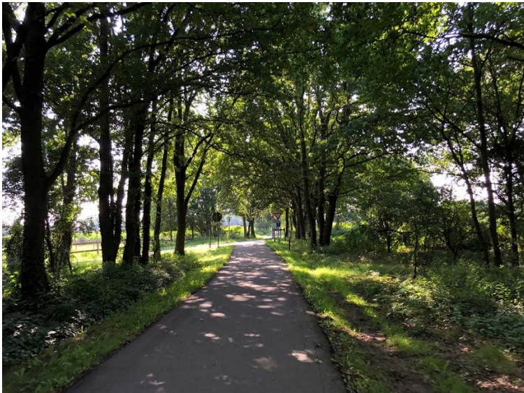
De oude spoorlijn 21A

Na KP 25 fiets je door het platteland. Wees zeer voorzichtig op de Venlossesteenweg. Eerst ga je rechts op de steenweg. Na een 100-tal meter steek je over. Uitkijken is de boodschap! Je rijdt langs oude boerderijen, uitgestrekte akkers en weiden. Je snuift weer een totaal andere sfeer op. Je fietst in een grote bocht rond Maaseik. Plots kom je aan de oude spoorlijn 21A die ooit Maaseik met Hasselt verbond. De lijn werd pas in 1874 ingereden. De geplande doortrekking naar Venlo werd nooit gerealiseerd. De sporen zijn opgebroken en de oude lijn is nu een fietssnelweg F751 die je tot in As kunt volgen.