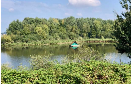
Kamperen op de Oude Maasarm