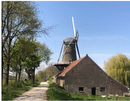
De stevig uit de kluiten gewassen Hompesche Molen