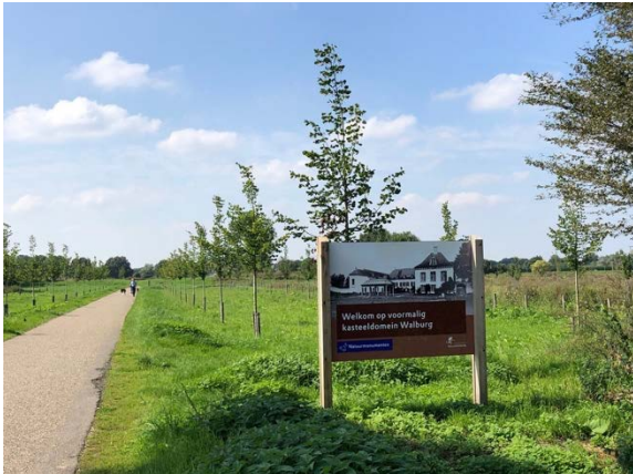
Je fietst voorbij kasteel Walburg