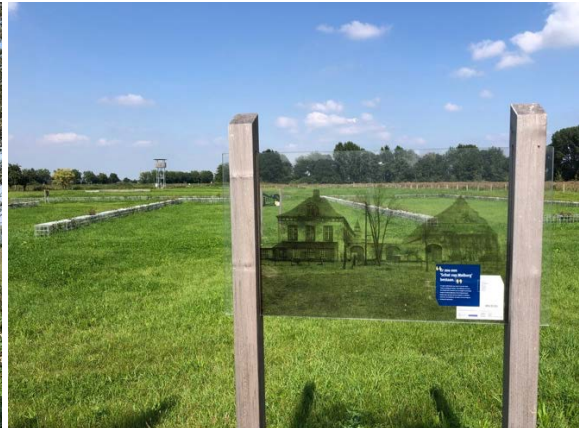
Een evocatie van het vroegere kasteel

Je slalomt naar het overzetbootje dat Ohé en Laak en het Belgische Ophoven verbindt. Het elektrisch bootje, 'De President Willy Claes', brengt je voor een prikje naar de andere oever. Check op voorhand de vaartijden! Tijdens de wintermaanden wordt er niet gevaren. De grens met Nederland ligt in het midden van de stroom, die hier enkel bevaarbaar is voor plezierboten. Na de korte overtocht kom je aan De Spaenjerd, een horecazaak met een prachtig terras.