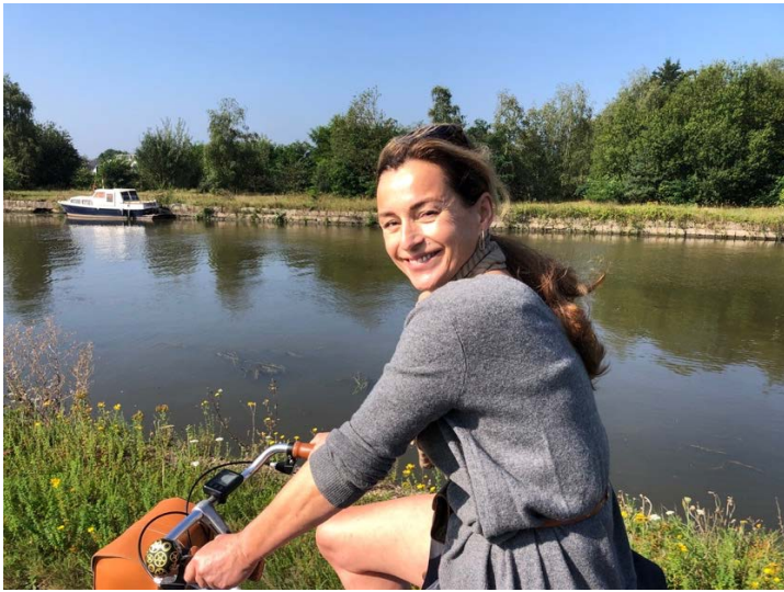
De laatste rechte lijn langs het Kanaal