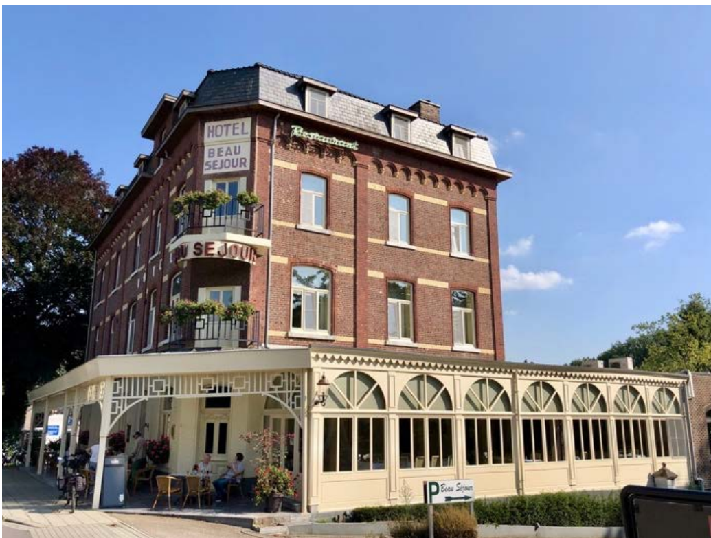
Beau Sejour, nostalgie troef!

Wat verder verlaat je het fietsknooppuntennetwerk. Draai links af en rijd in de richting van de kerktoren van Lanklaar. Jouw bedje is gespreid in de oude pastorie van het dorp. In de