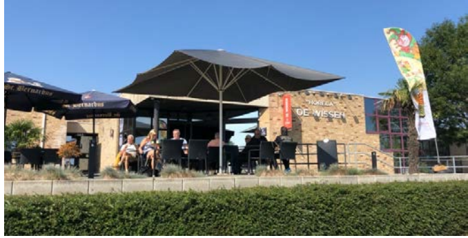
Brasserie De Wissen