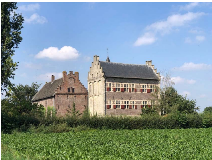
Kasteel Het Geudje, een luxueus buitenverblijf uit de 16 e eeuw