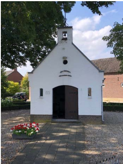
De kapel van Roosteren

Je komt in Roosteren, letterlijk het smalste stukje Nederland. Binnen een uurtje wandel je vanuit België door Roosteren naar Duitsland. Aan de Marie-kapel ga je naar links. Wees voorzichtig bij het oversteken van de drukke Maaseikerweg. De kapel is opgericht na de Tweede Wereldoorlog. Op de voorgevel lees je de tekst 'Onze Lieve Vrouw bescherm ons'. Aan de linkergevel hangt een plaquette met de namen van de oorlogsslachtoffers uit Roosteren. Links van het landelijk wegje stroomt de Maas, wat verder rechts het Julianakanaal. In 1925 stak de toen 16-jarige prinses Juliana de eerste spade in de grond voor de aanleg van een waterweg tussen Maastricht en Maasbracht. Het kanaal was broodnodig omdat de Grensmaas een te wisselvallige en dus onbetrouwbare waterstand heeft. Tien jaar later, in 1935, voer het eerste vrachtschip over een afstand van 36 km tussen beide steden. Drie sluizen vangen het hoogteverschil van 23 m op.