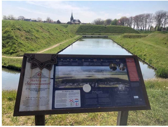
Eindeloze rust in Stevensweert, een prachtig vestingstadje