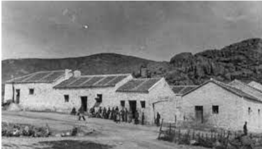
Destacamento Penal de Bustarviejo