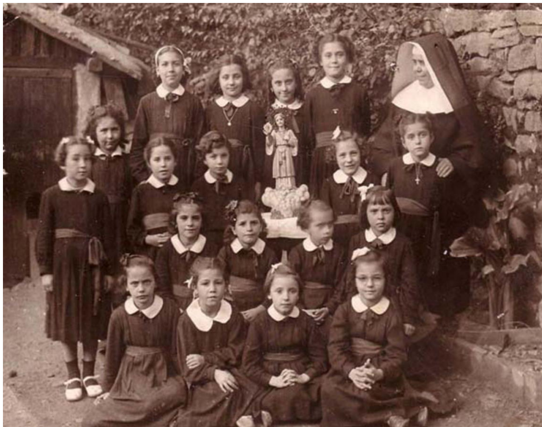
Clase en colegio Figaredo. 1951.

RESUMEN : La educación durante la etapa franquista seguía los principios y valores del nacionalsocialismo y de la iglesia católica. Se separaba a los niños por sexos, no todos tenían acceso a la educación, se privilegiaba a los centros religiosos y se potenciaban las cualidades que se suponían a niños y a niñas diferenciados según las expectativas de roles marcados.