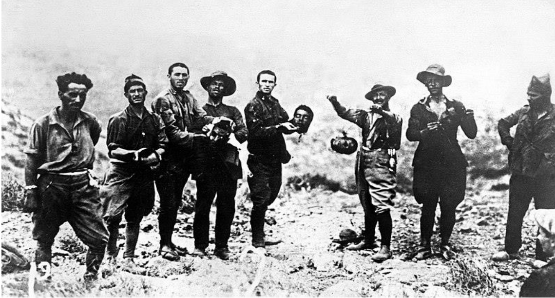
Miembros de la Legión mostrando las cabezas decapitadas de rebeldes capturados en la Guerra del Rif.

2.- Observad las siguientes imágenes y abrid un debate sobre la visión que tenían los españoles de inicio de siglo XX sobre los habitantes del norte de Marruecos y la situación colonial.