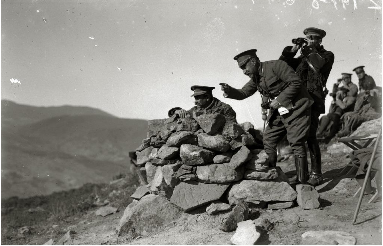
El Alto comisario de España en Marruecos, el general Dámaso Berenguer Fusté, observa las operaciones de Beni Arós, desde su campamento de Buharrax.

RESUMEN: El proceso de colonización, control militar del norte de Marruecos y la Guerra del Rif tuvieron numerosas consecuencias para la historia del siglo XX: supuso la puesta en evidencia la desigualdad de derechos por la diferenciación de clase, fue el origen de grandes protestas ciudadanas y puso las bases la creación de una élite de los altos mandos militares que organizaron el golpe de Estado de 1936.