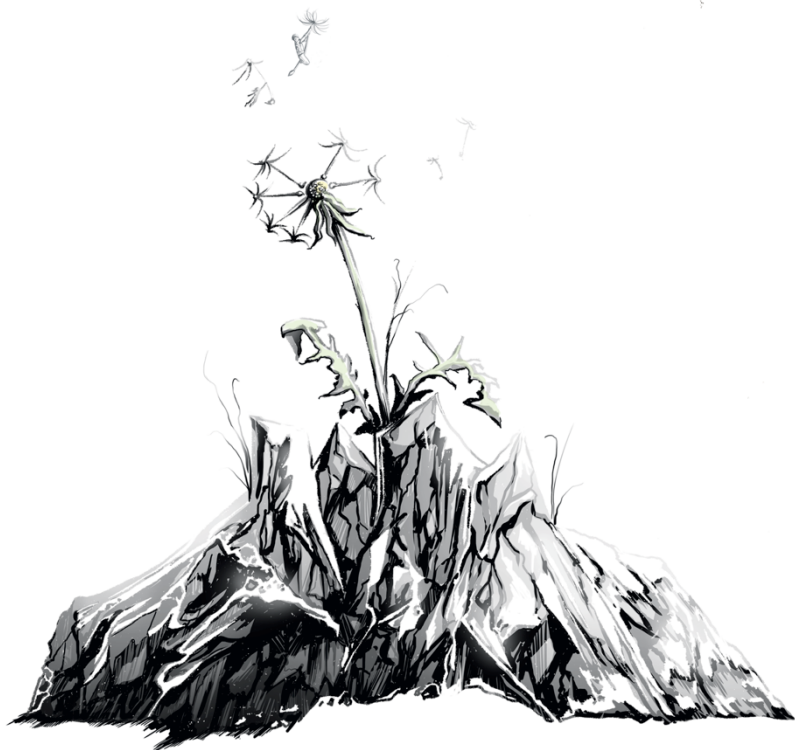
Illustration av Karolina Bergenwall