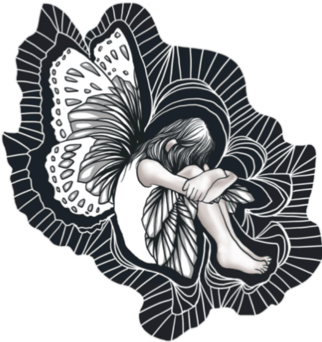
Illustration av Karolina Bergenwall . www.karolinabergenwall.se