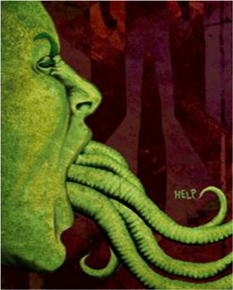
Illustration Jonas Laouini