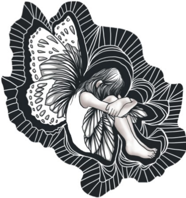
Illustration av Karolina Bergenwall .