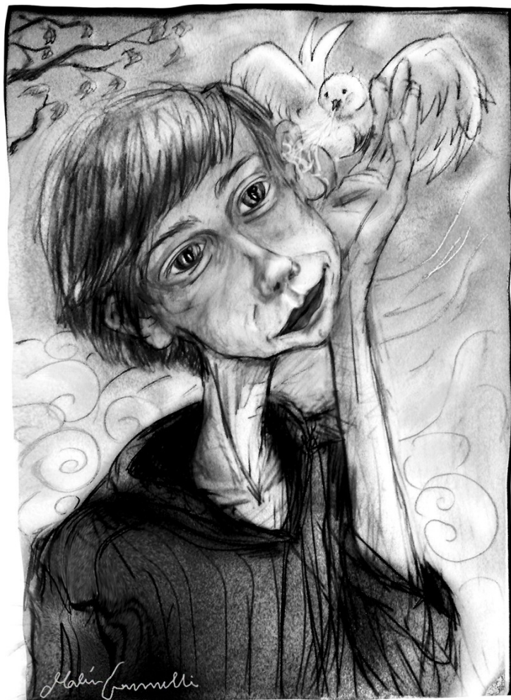
Illustration av Malin Gammelli