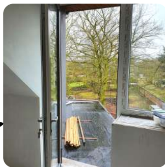
Chaussée de Bruxelles