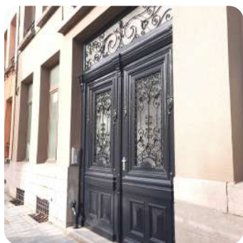
Rue de Pintamont