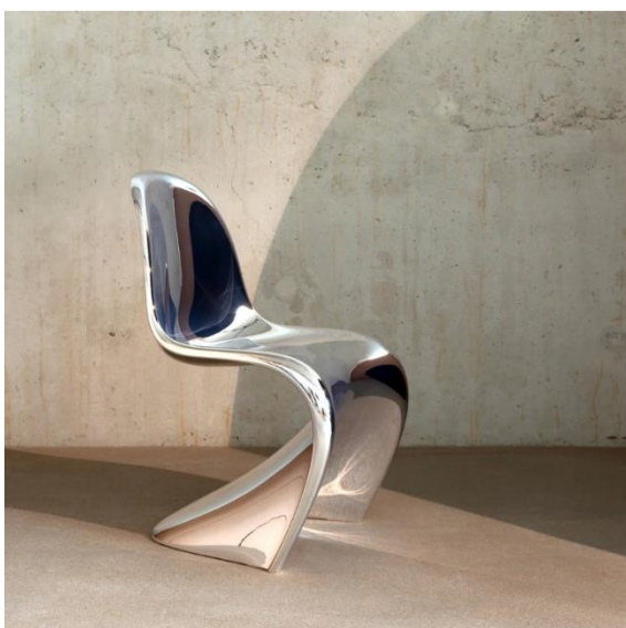
Verner Panton Chai Chrome - joink.nl

Wil je toch wat nieuws? Ga dan bijvoorbeeld voor een paddenstoellamp. En hoewel goud de laatste jaren onze harten heeft veroverd, brengt 2024 zilver en chroom weer op de markt! Dus ga eens lekker los en koop die retrolamp in het chroom!