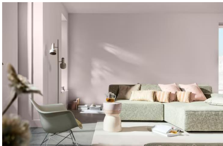
Kleur 'Sweet Embrace' www.akzonobel.com

date interieur! Houd je het liever wat gedeisd maar wil je toch mee zijn met de trend? Vul dan je eerder neutrale interieur aan met felgekleurde en bonte accessoires. Heb je er dan na een tijdje weer genoeg van, is je probleem ook in 1-2-3 weer van de baan.