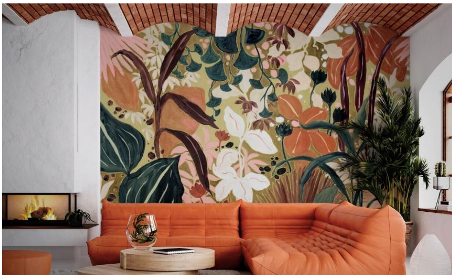
Sfeerbeeld en fotobehang - Photowall.com

Wil je toch wat nieuws? Ga dan bijvoorbeeld voor een paddenstoellamp. En hoewel goud de laatste jaren onze harten heeft veroverd, brengt 2024 zilver en chroom weer op de markt! Dus ga eens lekker los en koop die retrolamp in het chroom!