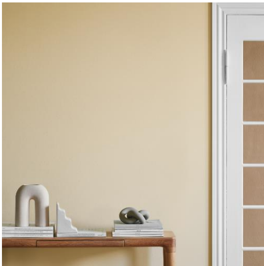
Kleur 'Limitless' - www.histor.nl

trendkleuren voor 2024 namen dragen als Healing Blue (BOSS Paints) , Limitless (Sigma/Histor) en Sweet Embrace (Sikkens/Levis/Flexa) . We gaan zelfs bewust extra vakken maken om meer kleur te kunnen toepassen! Dacht je dus dat die lambrisering uit de tijd was, dan hebben wij goed nieuws! Met de juiste tips en tricks, een klein zakcentje en wat DIY-vingers heb je in een handomdraai weer een superhip en up-to-