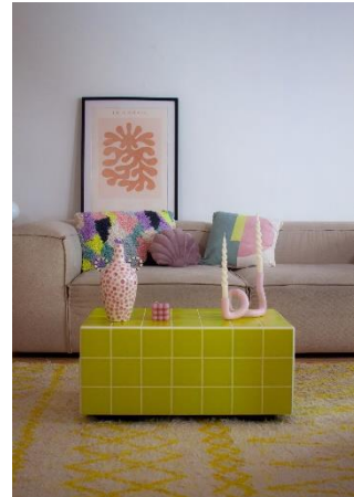
Sfeerbeeld - etsy.com

Don't worry, er zijn uiteraard ook andere opties voor het kersverse jaar, zij het met een knipoog naar het verleden! De 70's komen op een hedendaagse manier terug onder de vorm van bijzondere behangpatronen, geometrische vormen en materialen als fluweel en rotan. Uiteraard gecombineerd met de typische 70's-kleuren groen, bruin en oranje. Haal je vintage items dus maar snel weer boven.