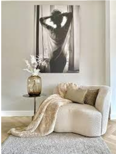
Sfeerbeeld - homedeco.nl

Ook de hoekjes van keukens en badkamerkasten durven zelfs al eens te verdwijnen in het komende jaar... Al die zachte vormen combineren we maar al te graag met (warme) houtsoorten, neutrale kleuren en natuurlijke materialen. Wol, bouclé en andere zachte stoffen verhogen de knuffelgraad van ons interieur! En de kers op de taart: aangename geuren en de échte gezelligheid van kaarsen! Wij hebben alvast het één en ander