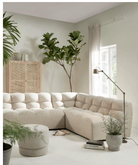
Sfeerbeeld - Karwei.nl