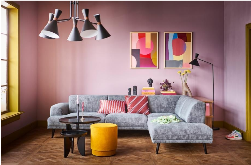
Sfeerbeeld - eliving.nl

En zo'n boeltje kunst in huis geeft soms al eens een wat eclectische indruk . Maar ook dat siert het interieurlandschap in 2024. Een mix van bonte en vrolijke kleuren brengen een lach op je gezicht en happy vibes in je huiskamer! Glossy materialen , een mix van felroze, fluogeel, pastelblauw... Het kan allemaal! Het is dan ook niet voor niets dat de