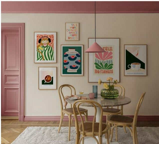
Sfeerbeeld - desenio.be

En er wordt daarbij voor niets teruggedeinsd: hoe extremer, hoe beter! Het begrip 'extreme crafts' vind je eind '24 waarschijnlijk terug bij de kansmakers voor het 'Woord van het Jaar'. Het is trouwens net de imperfectie van al deze materialen en items die we (on)bewust omarmen: het helpt ons om de kleine foutjes die we allemaal maken voor lief te nemen!