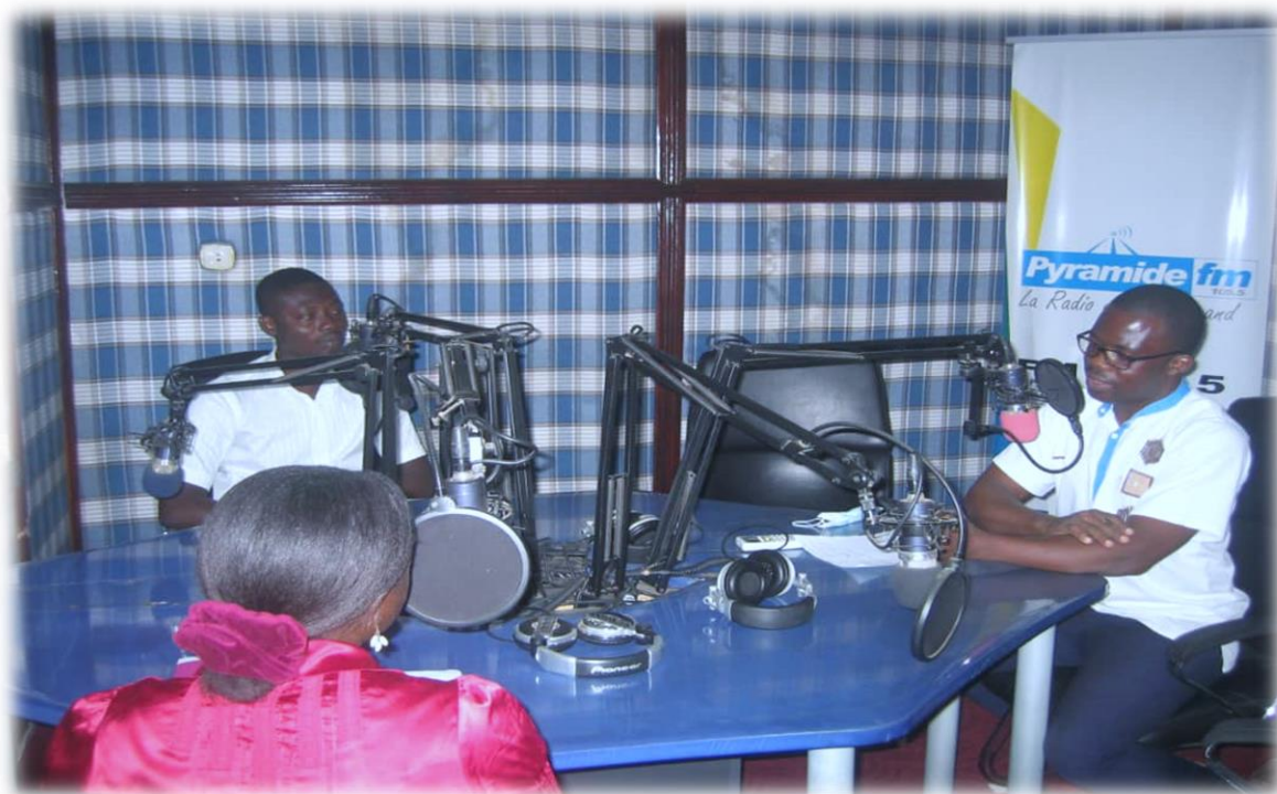
Journée mondiale de lutte contre le SIDA : Les membres de l'ONG RAPAA lors de l'émission radiophonique sur Pyramide FM, Lomé le 07 décembre 2020