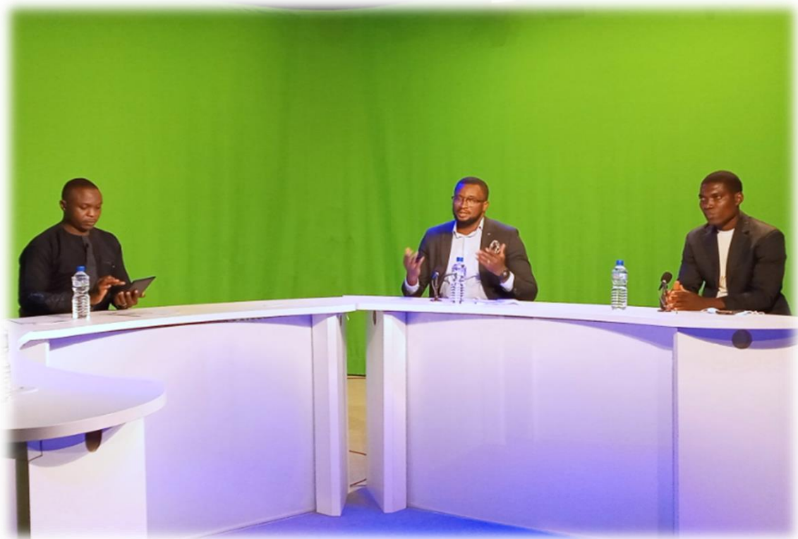
L'équipe de RAPAA reçue dans l'émission « On Fait Dla Télé » de la TVT dans le cadre de la Journée Internationale de lutte contre la drogue, Lomé le 25 juin 2020