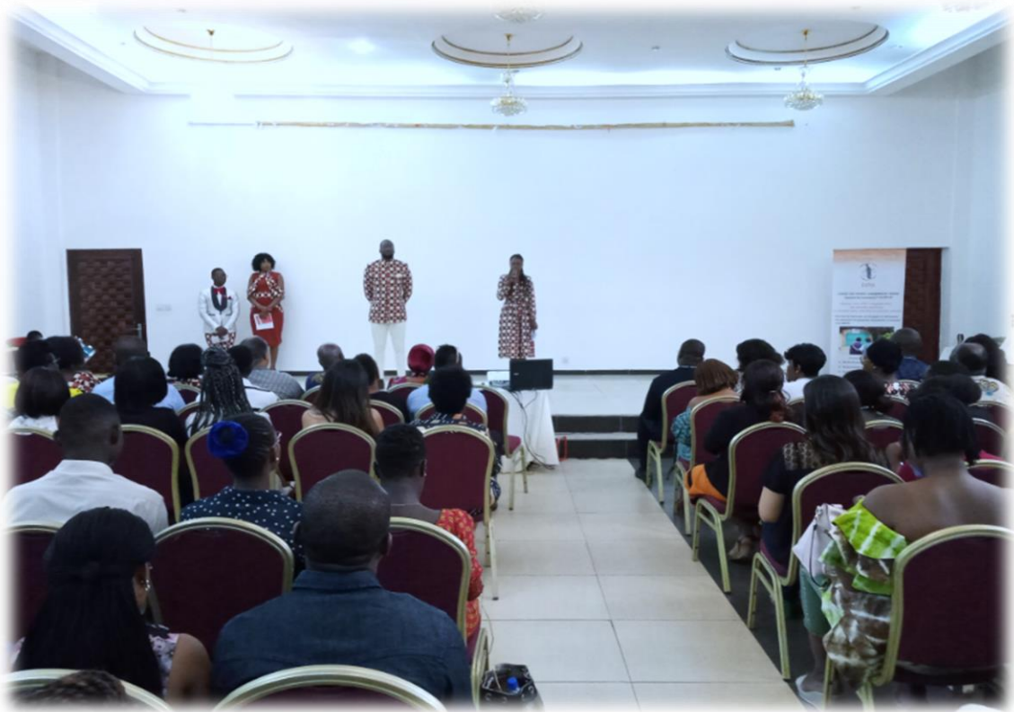
Présentation de l'ONG RAPAA lors de la conférence publique « Comment réussir sa vie sentimentale » avec le coach Alexandre CORMONT. Hôtel Eda-Oba le 15 février 2020