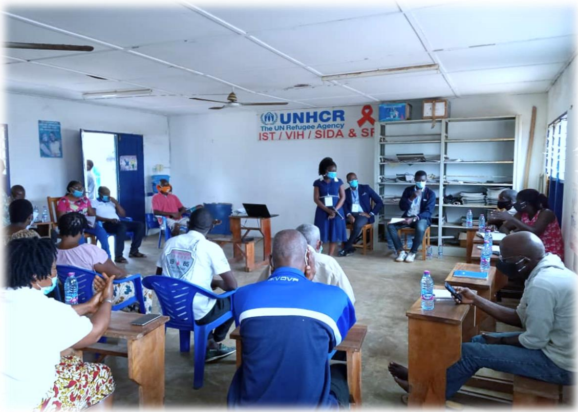
Séance de sensibilisation avec les habitants du camp de réfugiés à Avépozo, le 07 octobre 2020