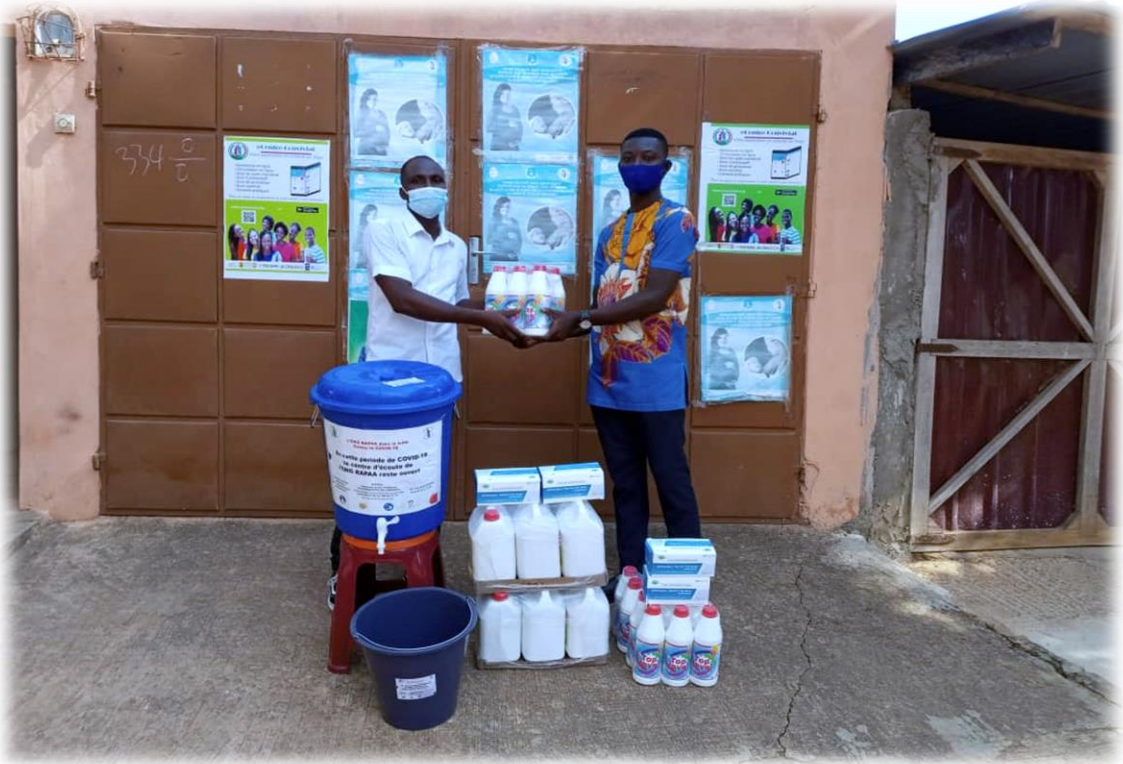
Don de RAPAA en matériel de protection au COVID-19 pour les usagers de services de l'ONG ASDEF, Lomé le 09 décembre 2020