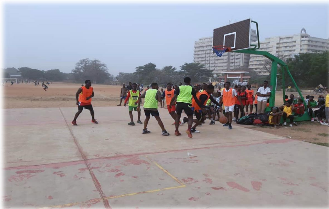
Activité de bien-être (basket) sur le terrain du Lycée de Tokoin, Lomé le 14 février 2020

Le volet accompagnement a appuyé le volet prévention lors des séances de sensibilisation à la Brigade Pour Mineurs, au MAREM et au camp des réfugiés d'Avépozo. Des sensibilisations ont été faites sur les différentes thématiques : consommation de substances psychoactives et pandémie du covid-19, lien entre la consommation des SPA, la pandémie du covid-19 et les personnes vivantes avec le VIH.