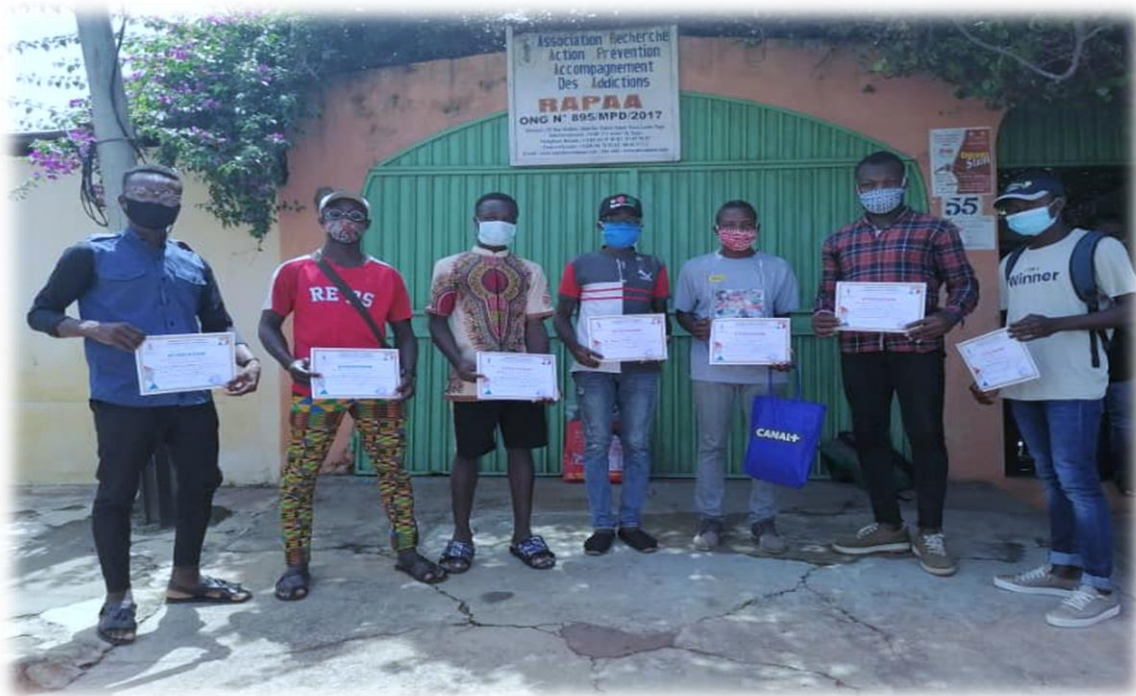
Les lauréats des concours organisés par RAPAA dans le cadre de Journée internationale de lutte contre l'abus et le trafic illicite des drogues, Lomé le 27 juin 2020