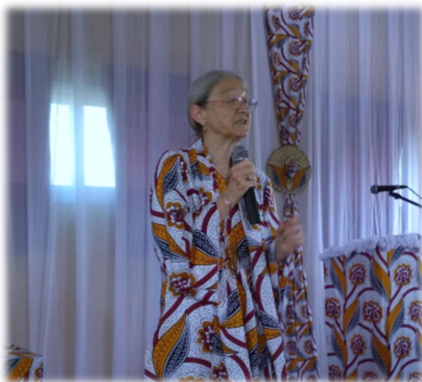
Conférence « Genre et addictions » animée par la Présidente de RAPAA à l'IAEC, le 09 mars 2020