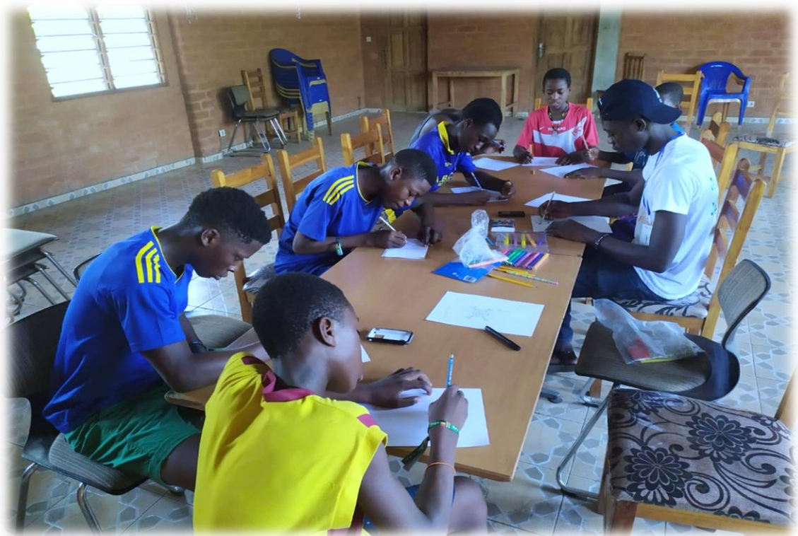
Séance de prévention avec les jeunes de l'ONG ANGE (atelier de dessin), le 07 mars 2020