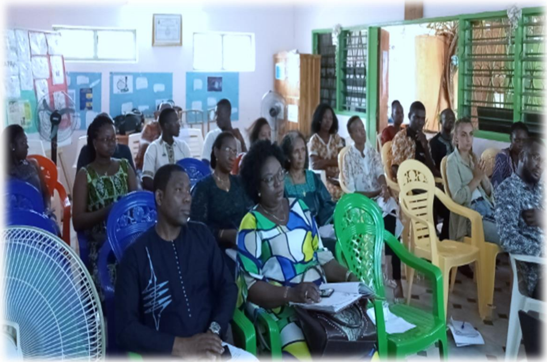
Assemblée Générale au siège de l'ONG RAPAA, le 29 février 2020