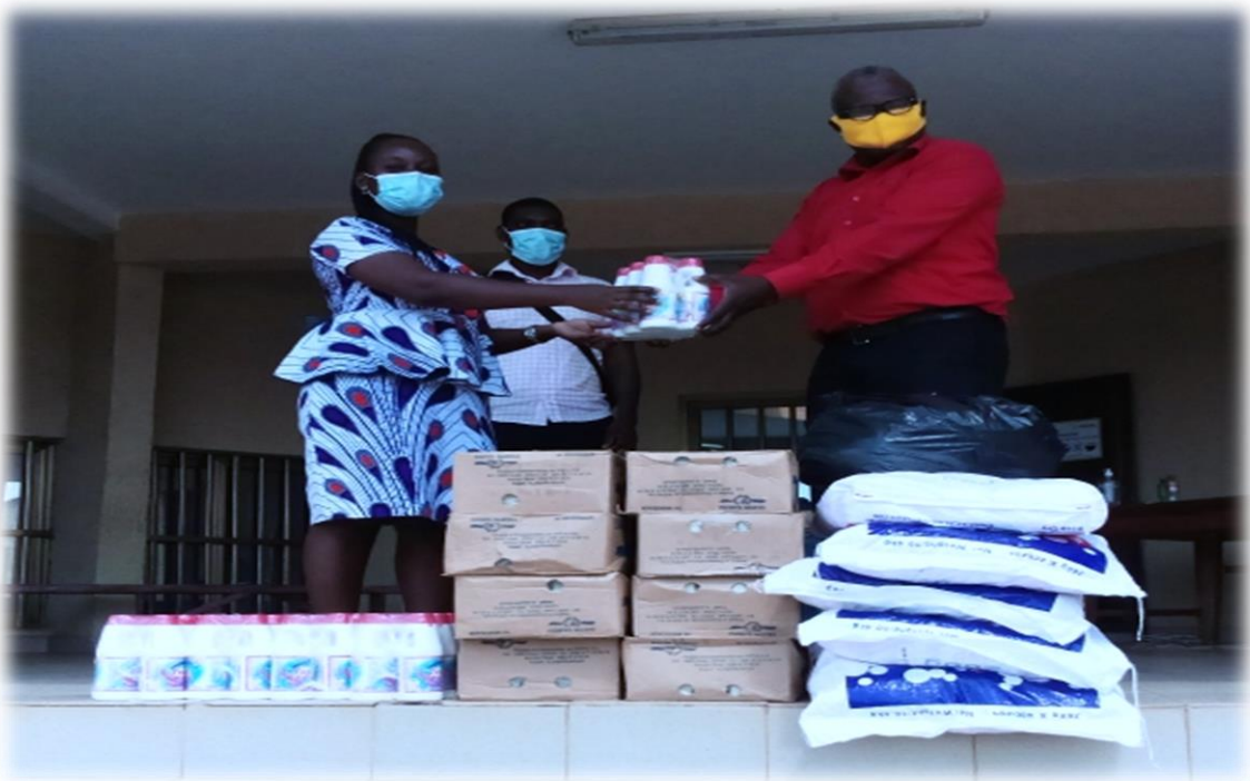
Remise de don en matériel de protection contre le COVID-19 pour les détenus de la Prison Civile de Kpalimé, le 17 décembre 2020