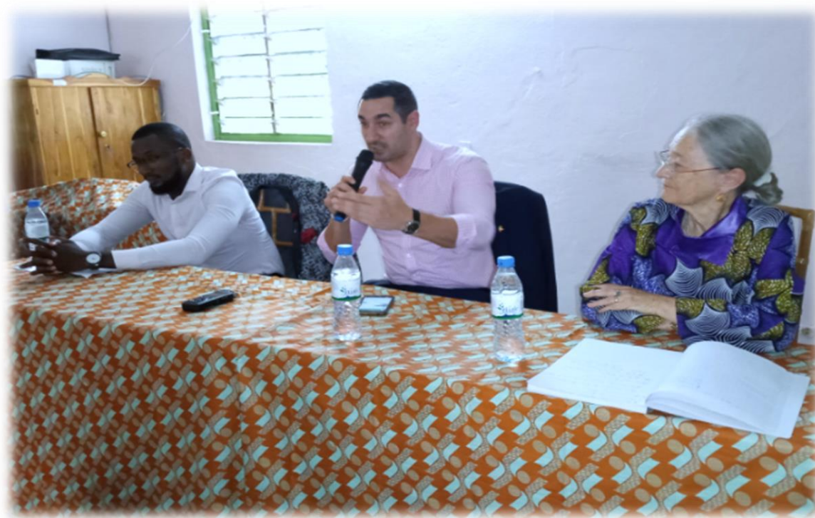
Conférence de presse en début de la semaine « Bien-être et vie sentimentale », le 11 février 2020