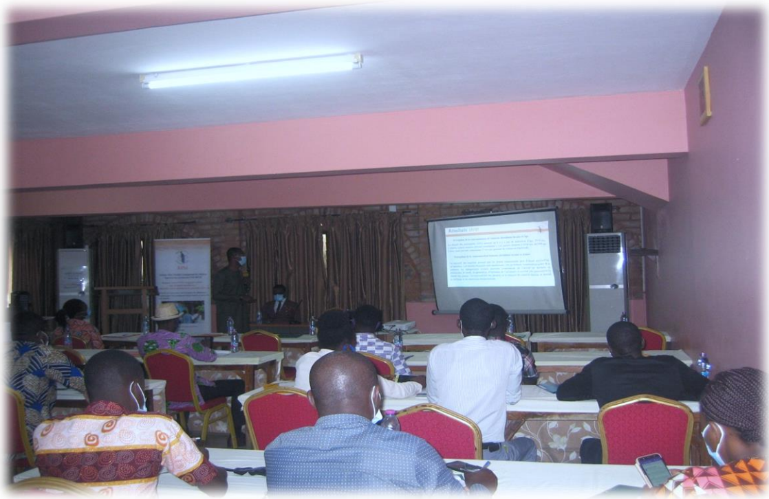
Atelier de restitution des résultats de l'étude sur les boissons alcoolisées locales. Salle Hibiscus de l'Agora Senghor le 19 novembre 2020