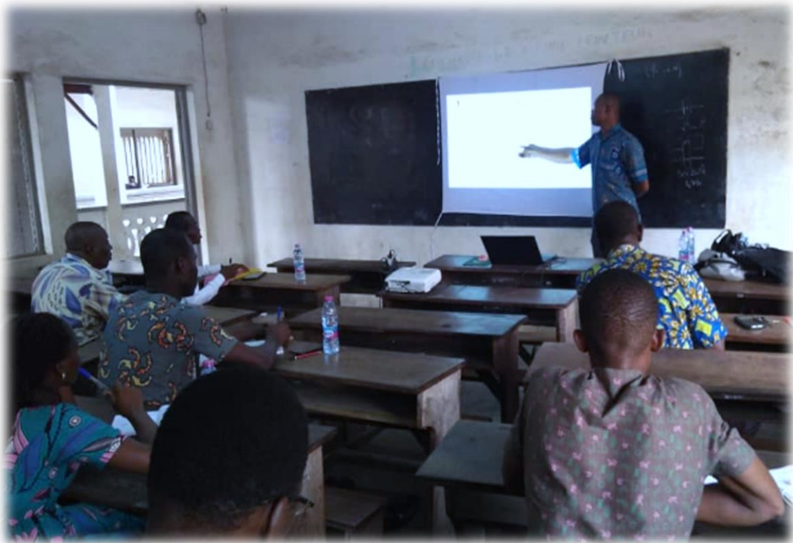
Formation des enseignants du lycée de Nyekonakpoè dans le cadre du projet de prévention en milieu scolaire financé par la BOAD, le 21 février 2020