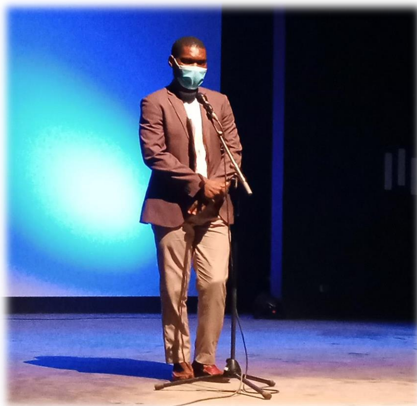
RAPAA lors de la présentation d'une communication à la grande soirée Calebasse Challenge, Institut Français, le 14 novembre 2020