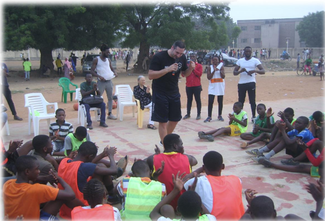
Séance de prévention avec les jeunes basketteurs de RAPAA sur le terrain du Lycée de Tokoin. Lomé, le 14 février 2020