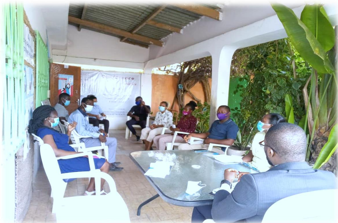
Réunion de coordination de la Direction Exécutive dans le strict respect des mesures de protection contre le COVID-19. Siège de RAPAA le 16 novembre 2020