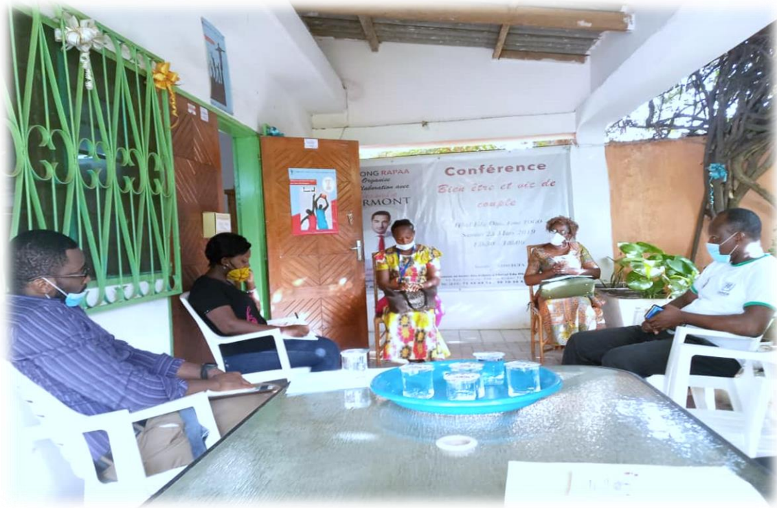
Rencontre avec le HCR au siège de RAPAA dans le cadre des réflexions sur un programme de prévention et d'accompagnement en faveur des réfugiés du camp d'Avépozo, le 16 juin 2020