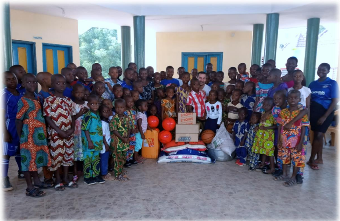
Action caritative à l'ONG SPES de Kpalimé, le 16 février 2020