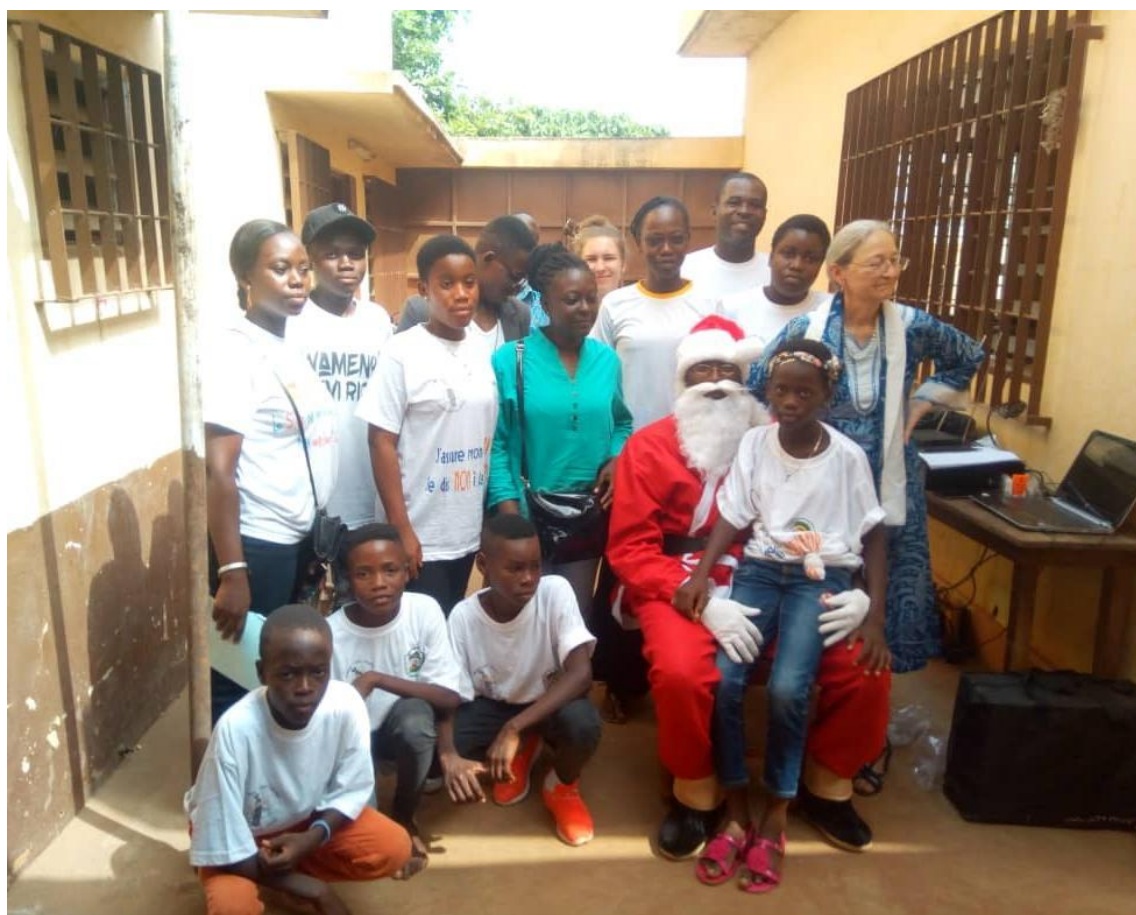
Noël à la Brigade Pour Mineurs, 24 décembre 2019