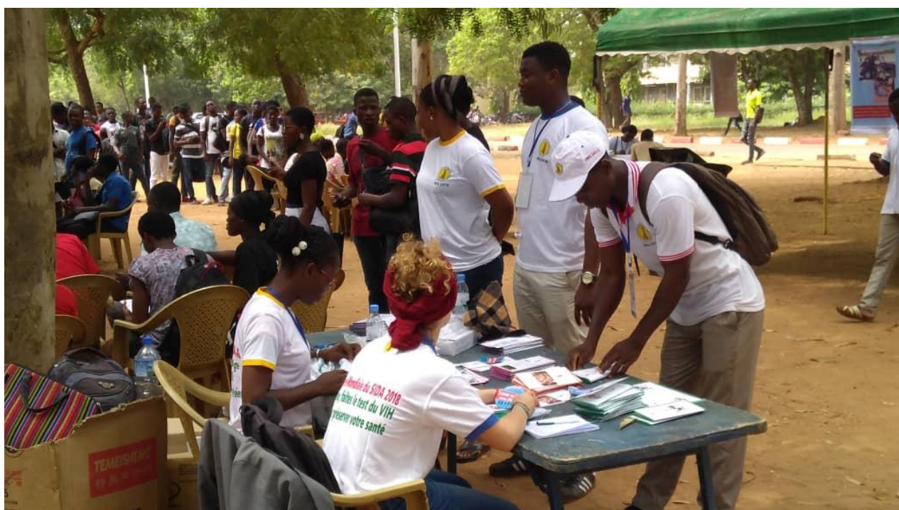
Séance de dépistage VIH/sida et sensibilisation sur la contamination en lien avec la consommation de substances psychoactives à l'Université de Lomé pour le compte de la Journée Mondiale de Lutte contre le Sida, 11-12 décembre 2018

RAPAA s'intéresse aussi à la thématique Genre et a mené une émission sur le thème genre et addictions le 6 novembre 2018 sur la radio Nana FM