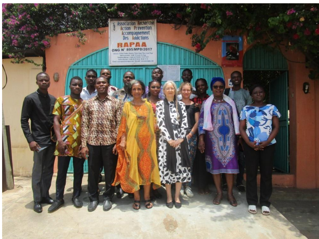
Les membres de l'ONG RAPAA à la sortie de l'Assemblée Générale 2018, 9 mars 2019