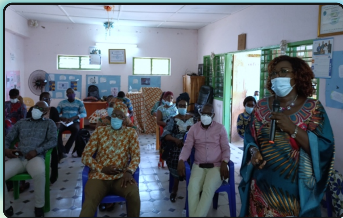
Conférence-débat sur le thème « Consommation de substances psychoactives : rôles et responsabilités des familles dans la prévention et l'accompagnement de leurs enfants », Siège de RAPAA le 15 mai 2021

➤ Une conférence-débat sur le thème « Consommation de substances psychoactives : rôles des parents dans la prévention et l'accompagnement de leurs enfants », conférence qui s'est tenue le samedi 15 mai 2021 au siège de l'ONG RAPAA. La conférence-débat a réuni une quinzaine de participants dont les parents, les services étatiques et les organes de la presse écrite et audiovisuelle.