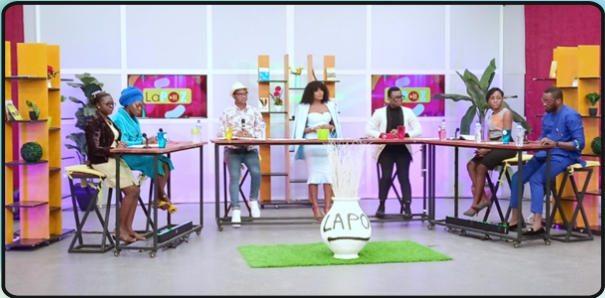
L'équipe de RAPAA reçue sur le plateau de l'émission « La POZ » de la TVT dans le cadre de la journée mondiale sans tabac, Lomé le 31 mai 2021