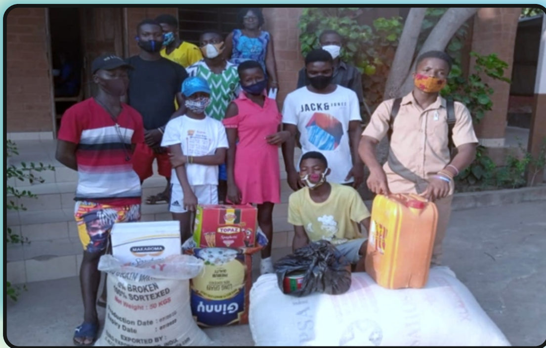
Remise de don composé de vivres aux pensionnaires de l'ONG ANGE, Lomé le 14 janvier 2021