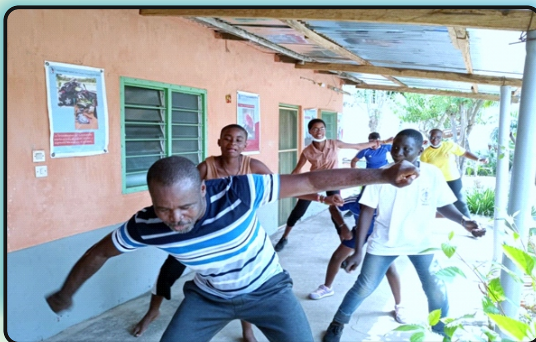
Atelier de chorégraphie avec les jeunes, Siège de RAPAA le 26 juin 2021