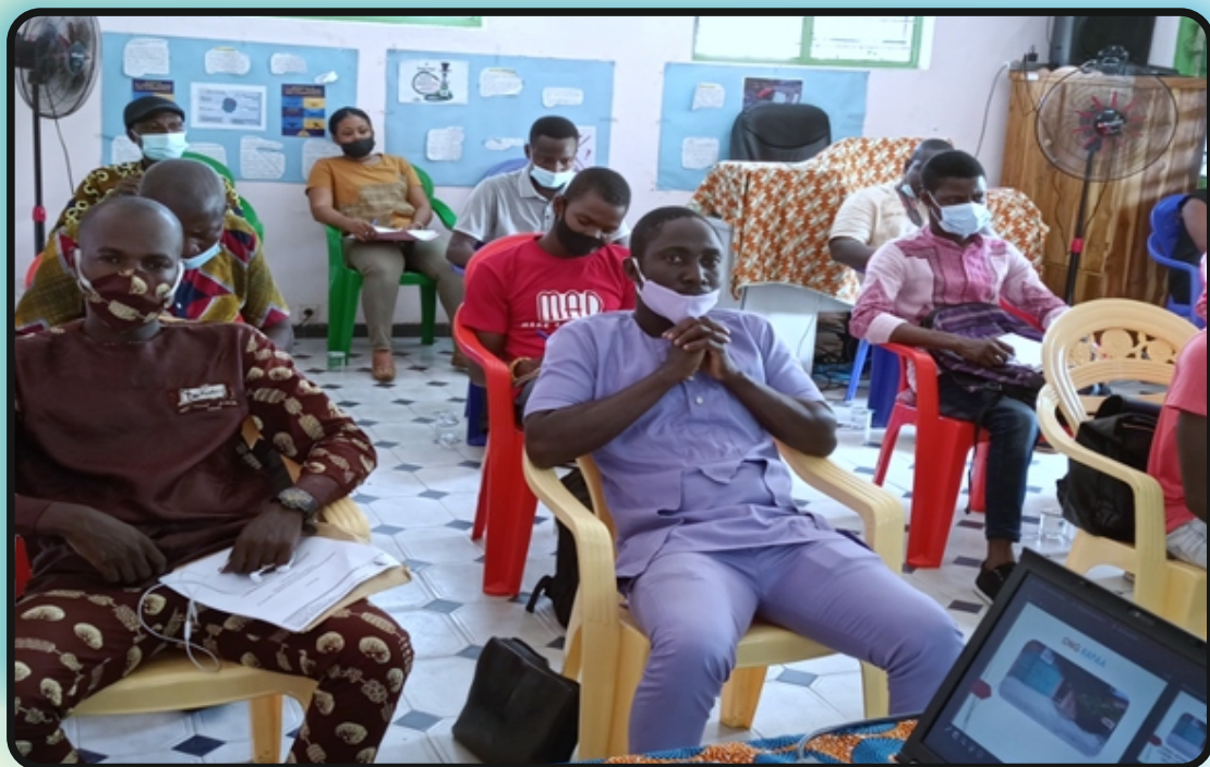
Les journalistes participant à la séance d'information sur les addictions aux substances psychoactives (vue partielle), Siège de RAPAA le 30 juin 2021

L'ONG RAPAA accorde une réelle importance au renforcement des capacités des acteurs externes avec lesquels elle interagit. C'est dans ce sens que RAPAA a organisé une séance d'information sur les addictions aux substances psychoactives à l'intention des journalistes et professionnels des médias. La séance s'est tenue le 30 juin au siège de RAPAA dans le cadre de la journée internationale contre l'abus et le trafic illicite de drogues