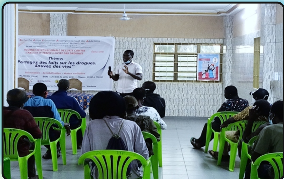
Action d'information et de sensibilisation à l'intention des usagers de drogues, Bè-Aklassou (Lomé) le 26 juin 2021