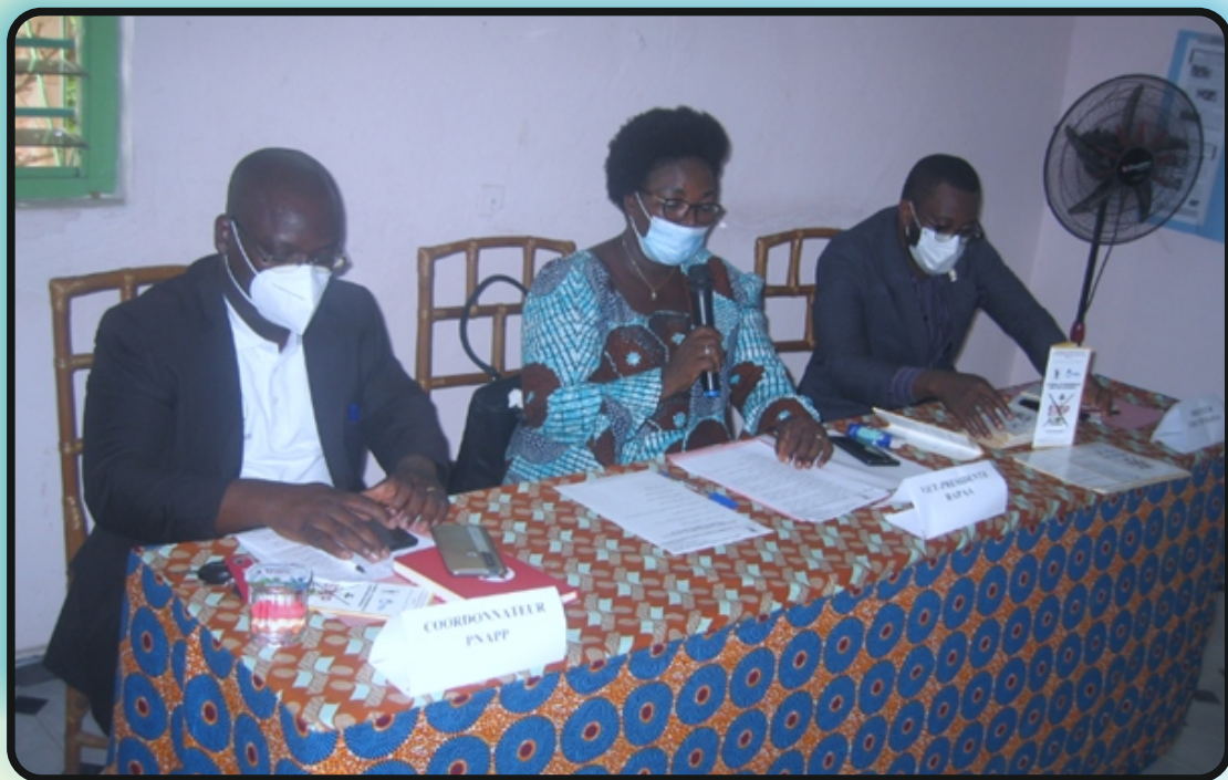
Lancement du dépliant « La chicha : un phénomène de mode très dangereux », Siège de l'ONG RAPAA, le 02 juin 2021