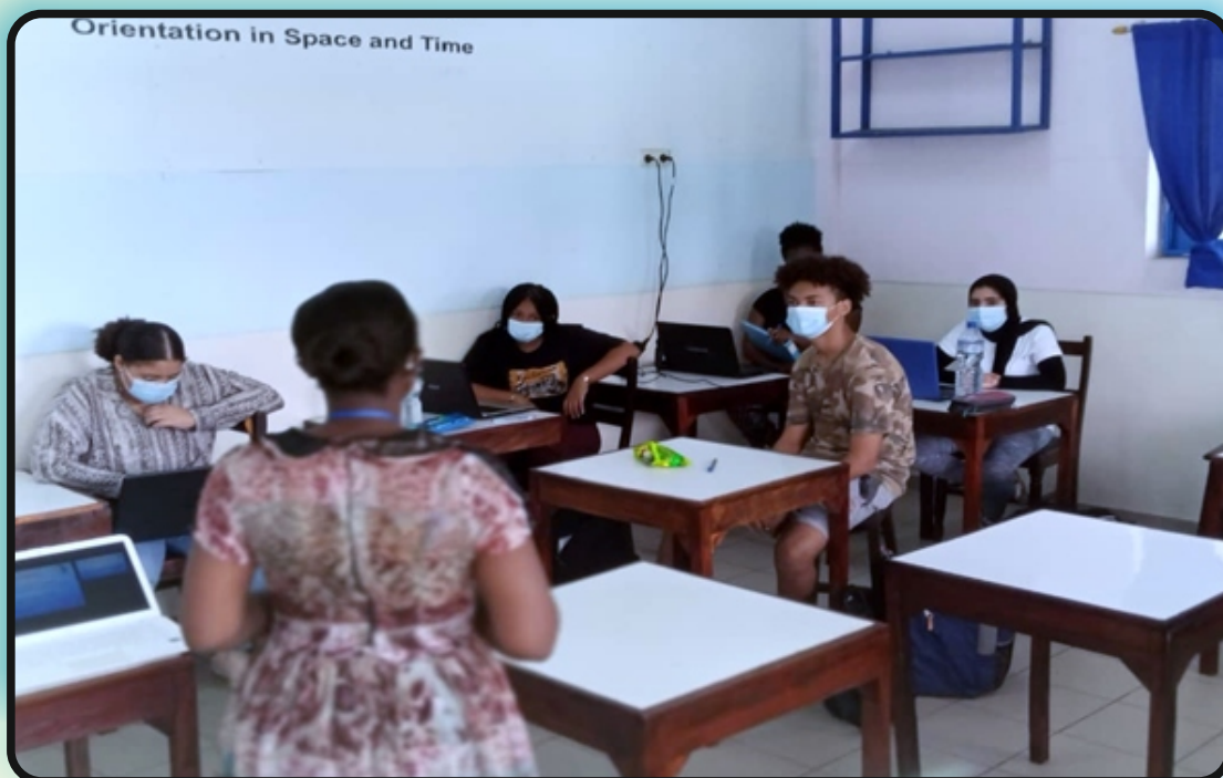
Séance de sensibilisation à l'intention des élèves de première de l'Ecole Internationale Arc-en-ciel, Lomé le 06 janvier 2021