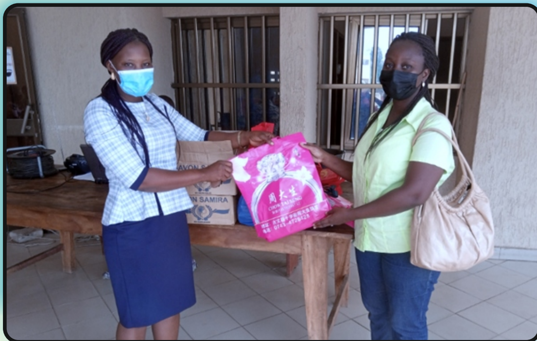
Remise de don pour les femmes détenues à la Prison Civile de Kpalimé dans le cadre de la journée internationale des droits des femmes, Kpalimé le 11 mars 2021