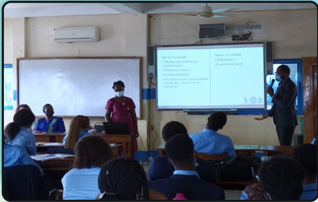
Séance d'information et d'échanges à l'intention des étudiants de l'Université privée ESIG Global Success, Lomé le 26 avril 2021

Le volet prévention de RAPAA a aussi saisi l'opportunité que représentent certaines journées internationales pour mener des campagnes médiatiques de sensibilisation