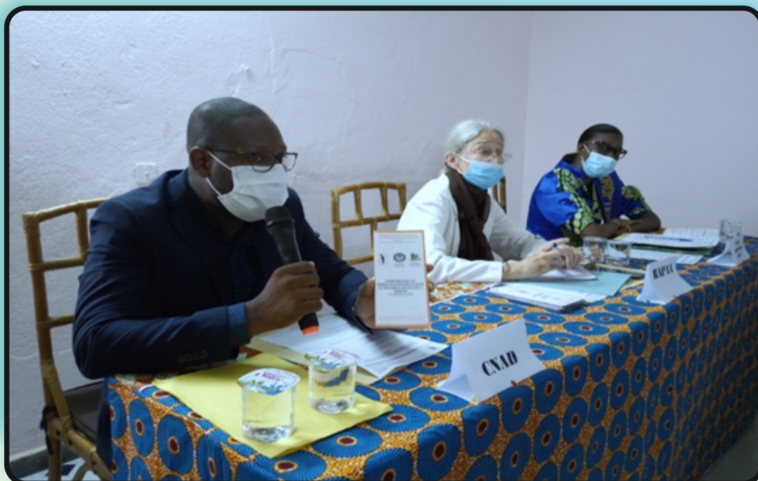
Cérémonie de lancement officiel du dépliant « Consommation de substances psychoactives et pratiques sexuelles à risques », Siège de RAPAA le 17 mars 2021