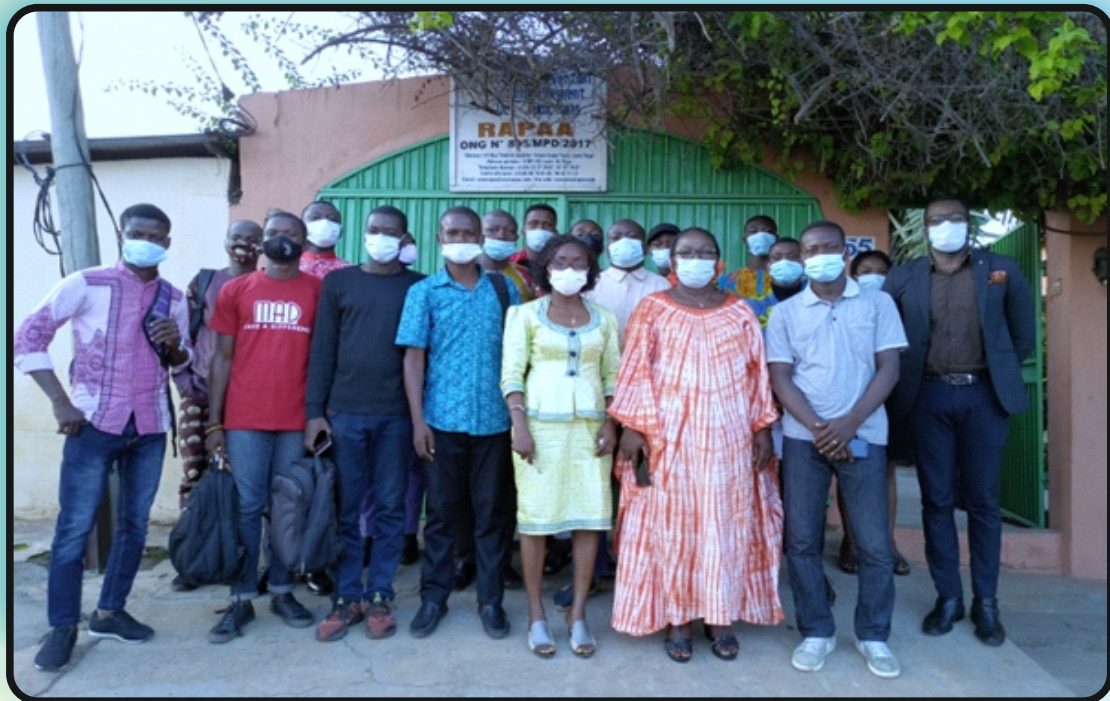
Photo de famille des journalistes participant à la séance d'information et des facilitateurs à l'issue des travaux, Siège de RAPAA le 30 juin 2021

juin 2021 au siège de RAPAA. Une quinzaine de journalistes ont été outillés sur la problématique de l'addiction aux substances psychoactives afin d'être des relais et diffuser les messages de prévention en direction du grand public dans une perspective éducative.