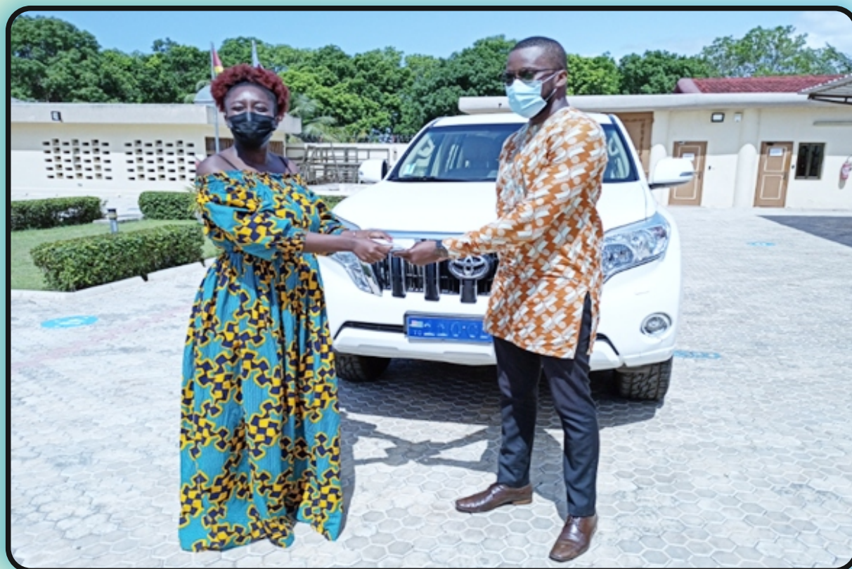
Réception par le Directeur Exécutif de l'ONG RAPAA du véhicule de terrain offert par la Banque Mondiale, Lomé le 21 mai 2021

En début d'année 2021, dans le cadre du projet santé mentale, l'ONG Handicap International a mis une moto à la disposition de RAPAA afin de faciliter les démarches administratives et les activités de terrain de notre ONG