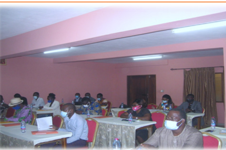
Les participants à l'atelier de restitution des résultats de l'étude sur les boissons alcoolisées locales, Salle Hibiscus de l'Agora Senghor le 19 novembre 2020