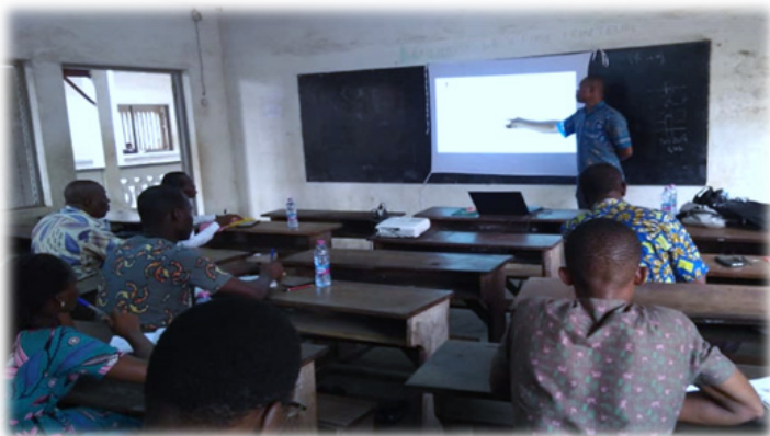
Formation des enseignants du lycée de Nyékonakpoè dans le cadre du projet de prévention en milieu scolaire financé par la BOAD, le 21 février 2020