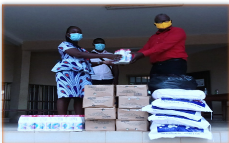
Remise de don en matériel de protection contre le COVID-19 pour les détenus de la Prison Civile de Kpalimé, Kpalimé le 17 décembre 2020