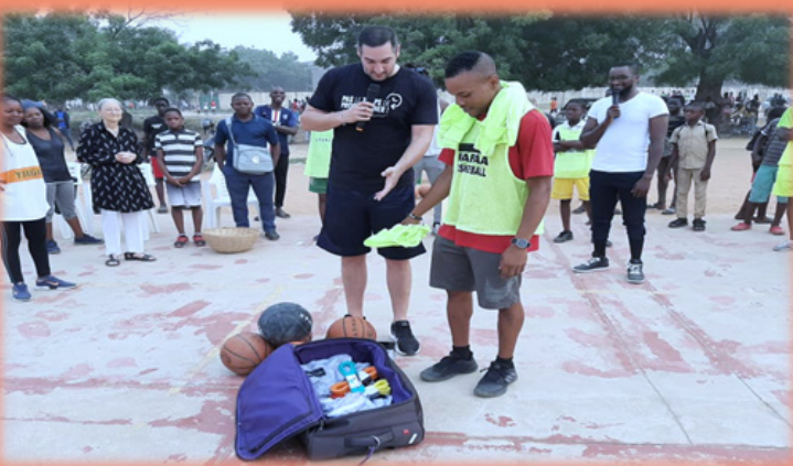
Remise de lots d'équipements sportifs à l'équipe de basket de RAPAA, le 14 février 2020