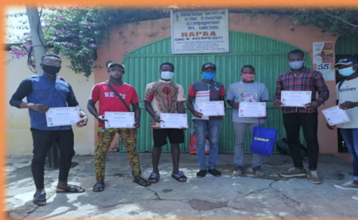
Les lauréats des différents concours organisés par l'ONG RAPAA, Lomé le 27 juin 2020