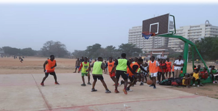
Activité de bien-être (basket) sur le terrain du Lycée de Tokoin, Lomé le 14 février 2020

Au cours du dernier trimestre 2020, RAPAA a mené un programme d'accompagnement psychosocial pour les réfugiés du camp d'Avépozo en collaboration avec le Haut-Commissariat aux Réfugiés, 175 consultations thérapeutiques ont été effectuées à l'intention de 118 personnes dont 64 femmes et 54 hommes, ainsi que deux groupes d'éducation thérapeutique un sur la violence avec 06 personnes (toutes des femmes) et l'autre sur les addictions avec 02 usagers de substances (hommes).