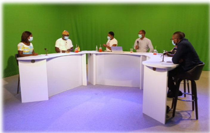
Lutte contre le COVID-19 et la consommation de drogues : l'équipe de l'ONG RAPAA reçue dans l'émission « La Poz » pour accentuer la prévention, le 04 mai 2020