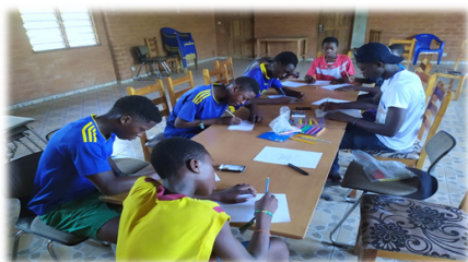
Séance de prévention à l'ONG ANGE (atelier de dessin), le 07 mars 2020