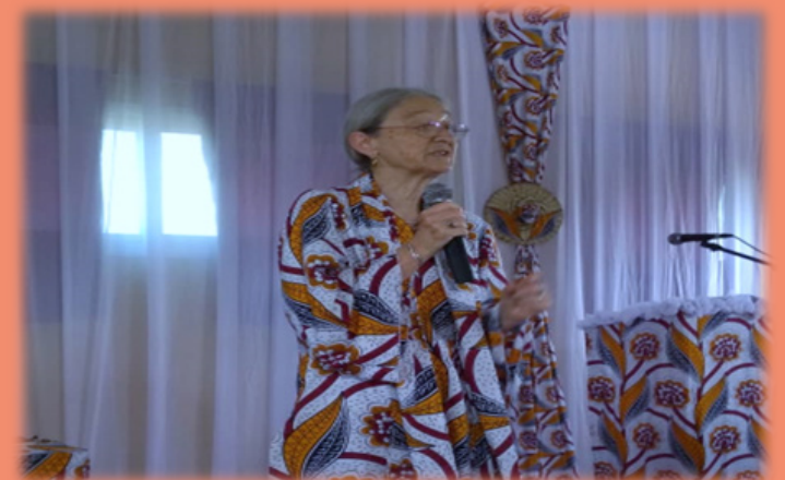
Conférence « Genre et addictions » animée par la Présidente de RAPAA à l'IAEC, le 09 mars 2020

RAPAA a marqué la célébration par une conférence-débat sur le thème « Genre et Addictions » animée par sa Présidente le 09 mars en partenariat avec l'Institut Africain d'Etudes Commerciales (IAEC) avec la participation d'environ 150 étudiants (filles et garçons).