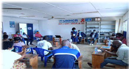
Séance de sensibilisation avec les habitants du camp de réfugiés à Avépozo, le 07 octobre 2020