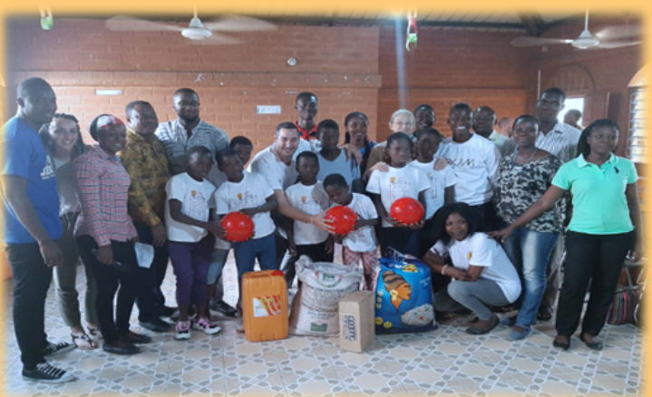
Remise de dons aux pensionnaires de l'ONG ANGE, le 12 février 2020

◀ Actions caritatives : dons de vivres et équipements sportifs pour les enfants et les jeunes en situation de vulnérabilité des ONG ANGE, SPES Lomé et Kpalimé.