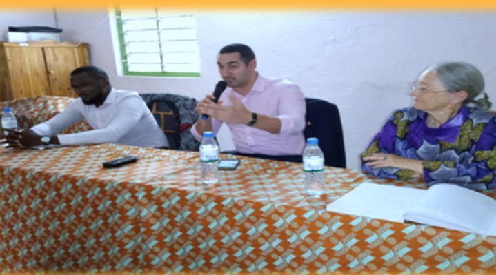
Conférence de presse au début de la semaine « Bien-être et vie sentimentale », le 11 février 2020