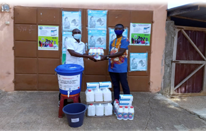
Don de RAPAA en matériel de protection au COVID-19 pour les usagers de services de l'ONG ASDEF, Lomé le 09 décembre 2020

Dans le cadre de la Journée Mondiale de lutte contre le SIDA (JMS), édition 2020, une campagne de prévention a été menée. Les messages de sensibilisation ont porté sur la contamination du VIH, la consommation de substances et la propagation du COVID-19 à travers : une émission radio (Emission Spéciale de la radio Pyramide FM) le 07 décembre 2020, un don de solidarité en matériel de protection au COVID-19 pour les usagers de services de l'ONG ASDEF, le 09 décembre 2020, la publication d'articles dans la presse écrite et en ligne (Togo-Presse et www.togobreakingnews.info ).