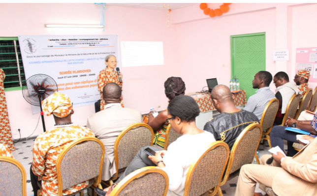
Soirée plaidoyer à l'intention des décideurs, le 27 juin 2019

En 2019, RAPAA a intensifié ses actions de plaidoyer pour :