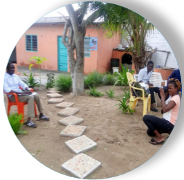
Atelier de photographie à l'ONG RAPAA, le 19 février 2019

► Atelier de basketball: 33 séances ont été effectuées au cours de l'année 2019 avec la participation de 20 jeunes.