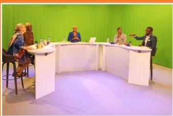
La Présidente et le Directeur Exécutif de l'ONG reçus dans l'émission « La Poz » de la TVT, le 09 décembre 2019