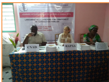
Cérémonie de lancement de la brochure d'information et de conseils aux familles, le 15 mai 2019

Le 15 mai 2019, l'ONG RAPAA a procédé au lancement de la brochure d'information et de conseils aux familles, en présence du Ministère de l'Action Sociale, du CNAD, des journalistes et de nombreux partenaires et invités.