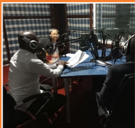
Les responsables de RAPAA reçus dans l'émission « Educivique » de Pyramide FM, le 10 décembre 2019