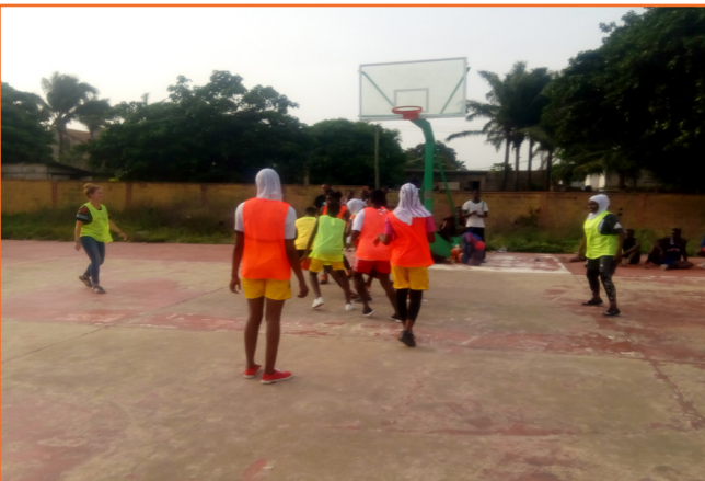
Activité de basket-ball avec les jeunes, Lycée de Tokoin le 29 mars 2019

► Atelier d'écriture : 11 séances ont été réalisées. Elles ont été animées par une assistante sociale, passionnée de l'écriture. Ces séances ont vu la participation de 05 personnes dont les membres de l'ONG, les clients qui ont manifesté un intérêt pour l'écriture