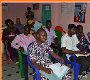
Les journalistes participant à la conférence de presse de la semaine « Pour une vie épanouie », le 22 mars 2019