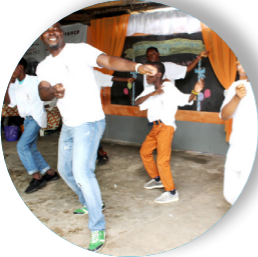
Prestation du groupe de chorégraphie de RAPAA lors de la journée porte ouverte, le 26 juin 2019

► Atelier de photographie: 09 séances de formation pratique ont été réalisées. Ces séances ont concerné les membres de RAPAA, les clients soit 06 personnes intéressées par la photographie. Le groupe de photographie de RAPAA a couvert la journée d'information et de mobilisation à l'Université de Lomé dans le cadre de la JMS.