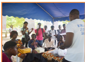
Séance de sensibilisation à l'Université de Lomé, 10 décembre 2019

▶ Une action de dépistage du VIH et de sensibilisation auprès des usagers de substances sur leur lieu de consommation, le 18 décembre 2019. Plus de 150 personnes ont effectué le test de dépistage et ont reçu des conseils quant aux risques liés à la consommation de substances.