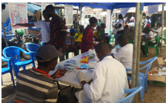
Sensibilisation et dépistage du VIH à l'intention des usagers de drogues, le 28 juin 2019

4. Un atelier d'écriture à l'intention des jeunes, le 29 juin 2019