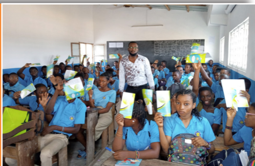
Prévention en milieu scolaire : RAPAA sensibilise les élèves du complexe « La Révélation » sur l'hygiène du cerveau, le 25 novembre 2019

RAPAA a aussi réalisé de nombreuses activités en direction du grand public. Les faits marquants de l'année 2019 sont :