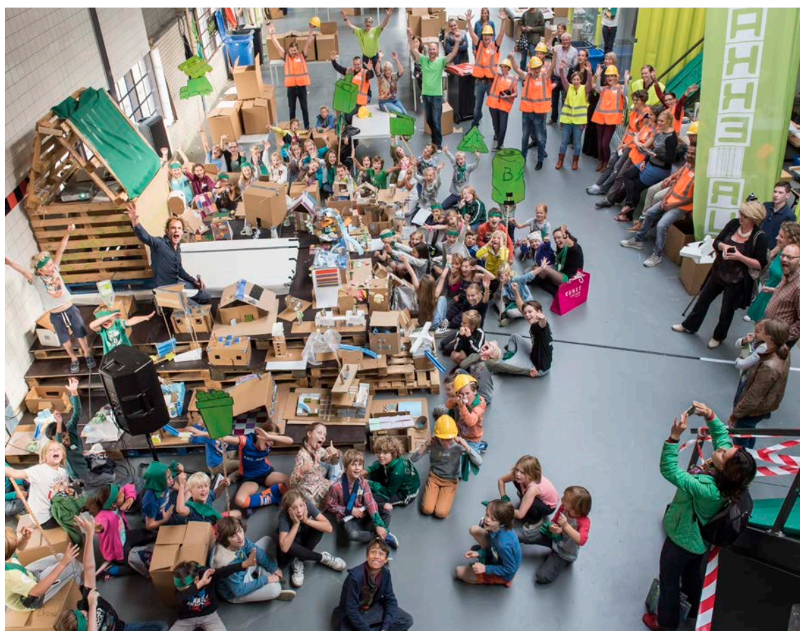
Fig.1 Impressie Archikidz Haarlem 2016

In dit project- en beleidsplan omschrijven we wie wij zijn, wat ons doel is en hoe we dit willen bereiken. We tonen kort een omschrijving van de dag, de aanloop hiernaartoe, de organisatie, werkwijze, planning, financiën en publiciteit. Wij vragen uw steun om onze wens uit te laten komen om in 2017 vele kinderen deel te laten nemen aan de tweede architectuurworkshop van Archikidz Haarlem.