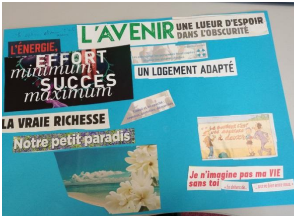
Qu'est-ce que l'aphasie a changé dans ma vie ?