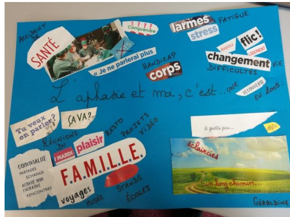
L'aphasie et moi, c'est...