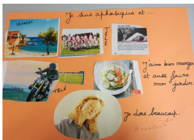
Je suis aphasique et ...