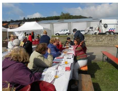
On a préféré la nature