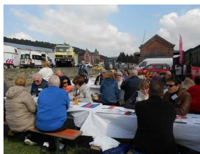
Le festival des trois vallées

Autres sorties d'informations : Comme chaque année, présentation de l'aphasie pour des jeunes filles aides-familiales le 8 octobre au Collège St- Joseph à Chimay.