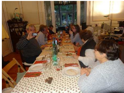
Et la photographe !