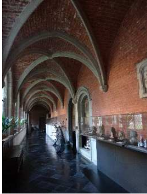
Hôpital Notre-Dame à la rose - Lessines