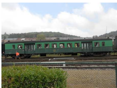
Le wagon restaurant

La sortie du groupe « Hansort » s'est faite à Mariembourg le 26 septembre – 32 participants dont 7 membres de chez nous.