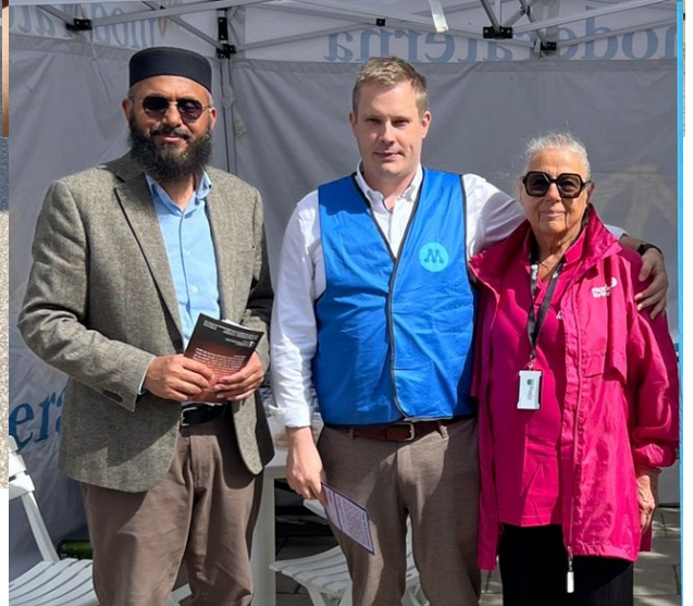
Majlis Ansullah Sveriges andligt bildande tidskrift