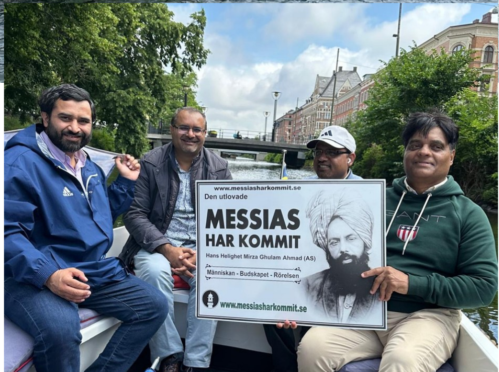
Majlis Ansullah Sveriges andligt bildande tidskrift