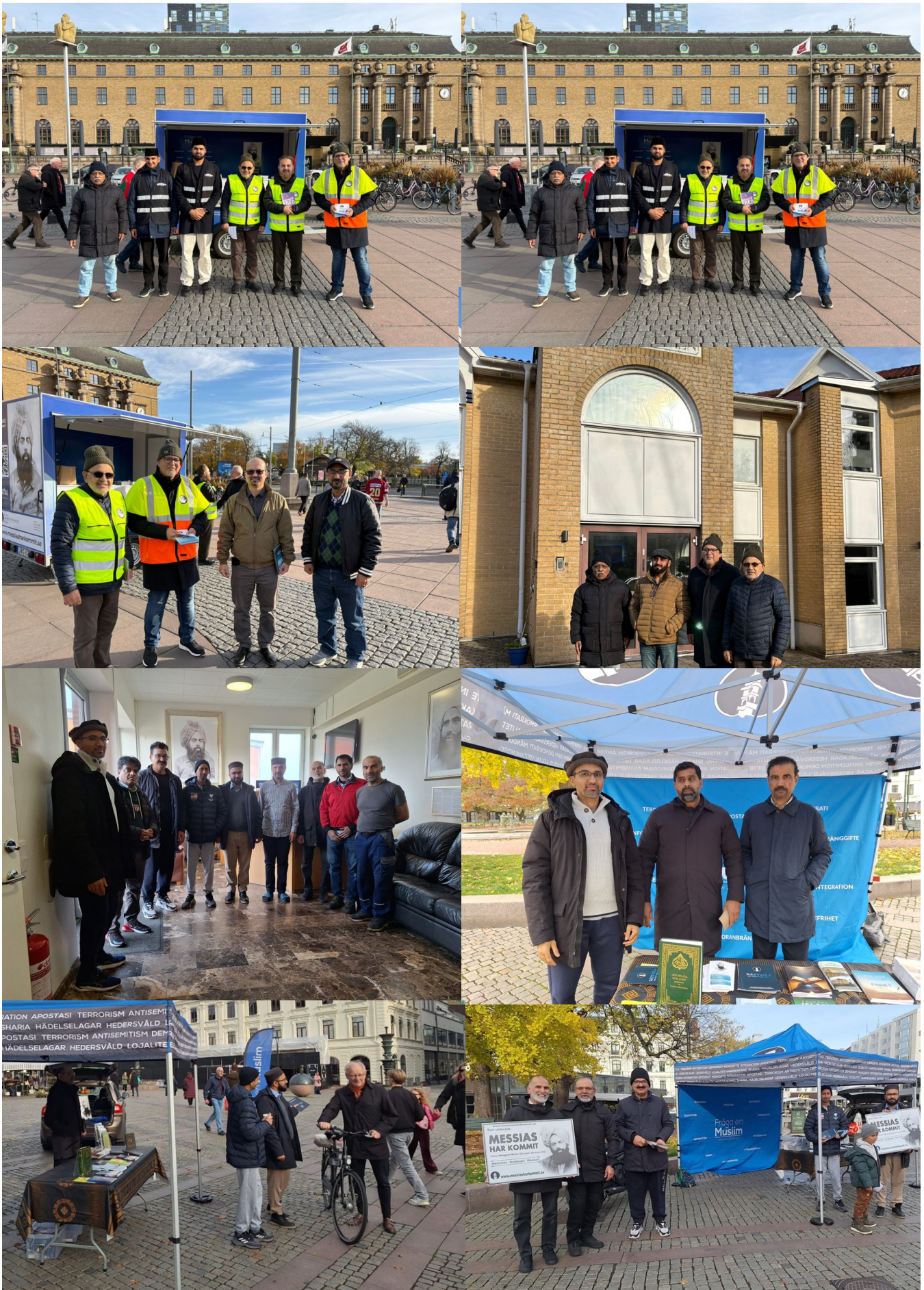
Majlis Ansallah Sveriges andligt bildande tidskrift