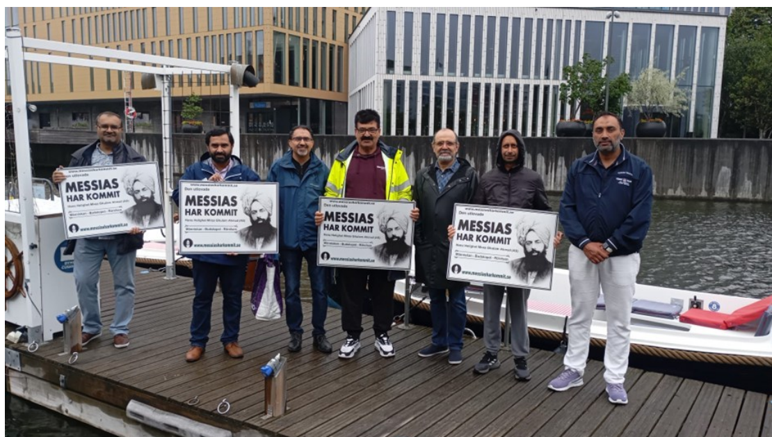
Majlis Ansarullah Sveriges andligt bildande tidskrift

Majlis Malmö hyrde en kanalbåt under några timmar, som färdades genom centrala Malmö och passerade landmärken såsom Malmö Live, Gustav Adolfs Torg, Slussen, Malmö C och universitetet. Båten gjorde flera turer fram och tillbaka, med Ansarullah-medlemmar ombord som visade skyltar med budskapen "Messias har kommit" och "Kärlek för alla, hat mot ingen".