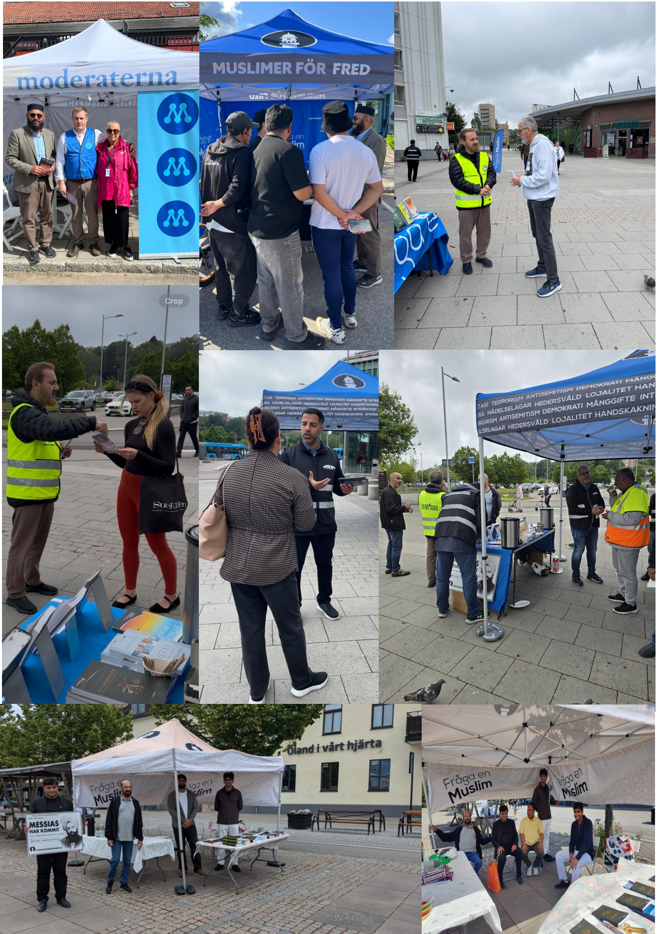
Majlis Ansullah Sveriges andligt bildande tidskrift