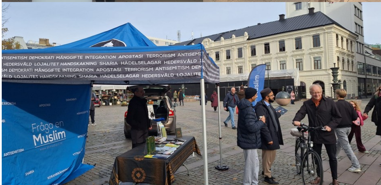
Majlis Ansullah Sveriges andligt bildande tidskrift