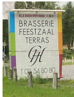
Punt 87 is Lommel centrum