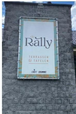
Punt 41 is de scoutsrally

Bij punt 88 goed rechts houden, de spoorbrug op gaan