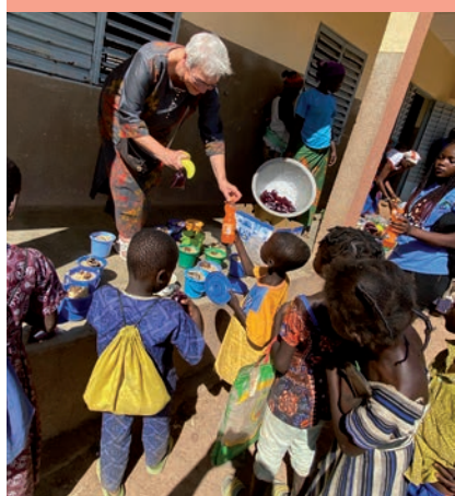
Samen eten en over de toekomstplannen babbelen...