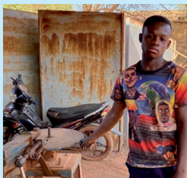
bij Lambert in het atelier