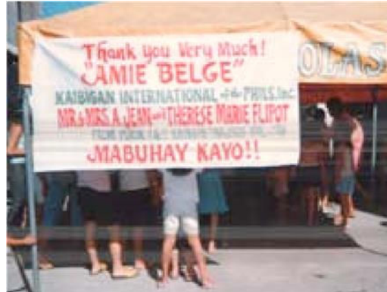
Laatste Free Clinic in Purok

De «Free Clinic» is ook actief in het «Opvangtehuis» voor onze petekinderen in en rond Manilla.