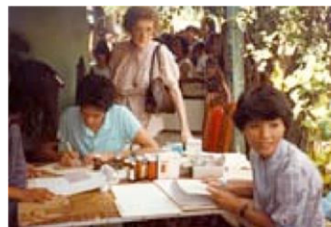
Bedeling van geneesmiddelen en vitaminen

Het enthousiasme voor het initiatief was zo algemeen dat de lokale overheid, die instond voor de gezondheidscontrole van de bevolking, zich voor die voorheen compleet verwaarloosde vissers ging interesseren. Zo kwam het dat diezelfde overheid in december 1985 besloot om de