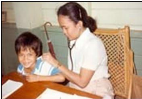
Een vrouwelijke arts onderzoekt een kind

De «Free clinic» kon rekenen op de welwillende en gratis hulp van ex-petekinderen die hun doktersdiploma behaald hadden. De sponsoring ervan gebeurde met de opbrengst van een 2e Kerstconcert en met de giften van onze immer trouwe weldoeners.