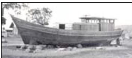
Een door de «Boat people» gebruikt bootje, zoals het te zien is in het kamp van Bataan.

«Boat people», Vietnamese vluchtelingen, kennen die hun land ontvlucht waren in hun ranke bootjes en deelden iedereen de 30 pesos uit die A.M.I.E. maandelijks gaf voor een honderdtal niet begeleide tieners in afwachting dat ze een land vonden dat hen definitief wou opvangen.