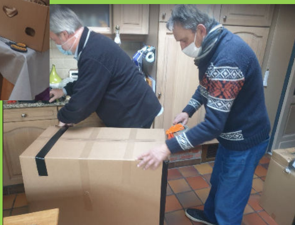
Foto 4: geleverde dozen worden uitgepakt en de goederen verspreid

Wereldwijd zijn er expediteurs die gespecialiseerd zijn om dergelijke dozen te verschepen. Ook in België zijn er firma's die deze boxen verzamelen, in een container stoppen, en zo naar de Filipijnen versturen. Daardoor