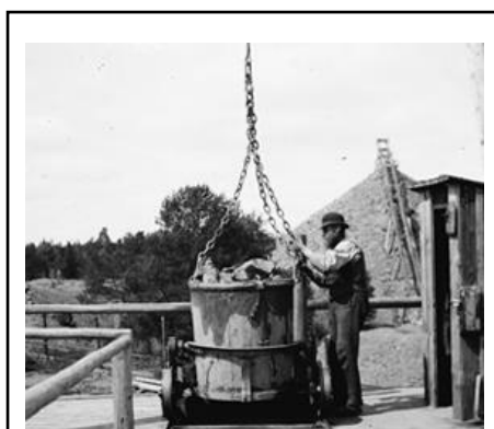
Maskingruvekran vid Ramhälls gruvor. Fotograf och årtal okänt.