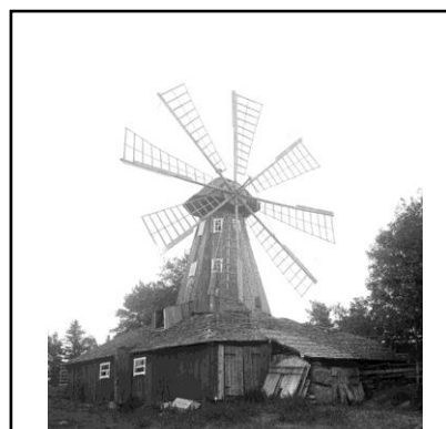
Vädervärnsbranschen i Alunda 1938.