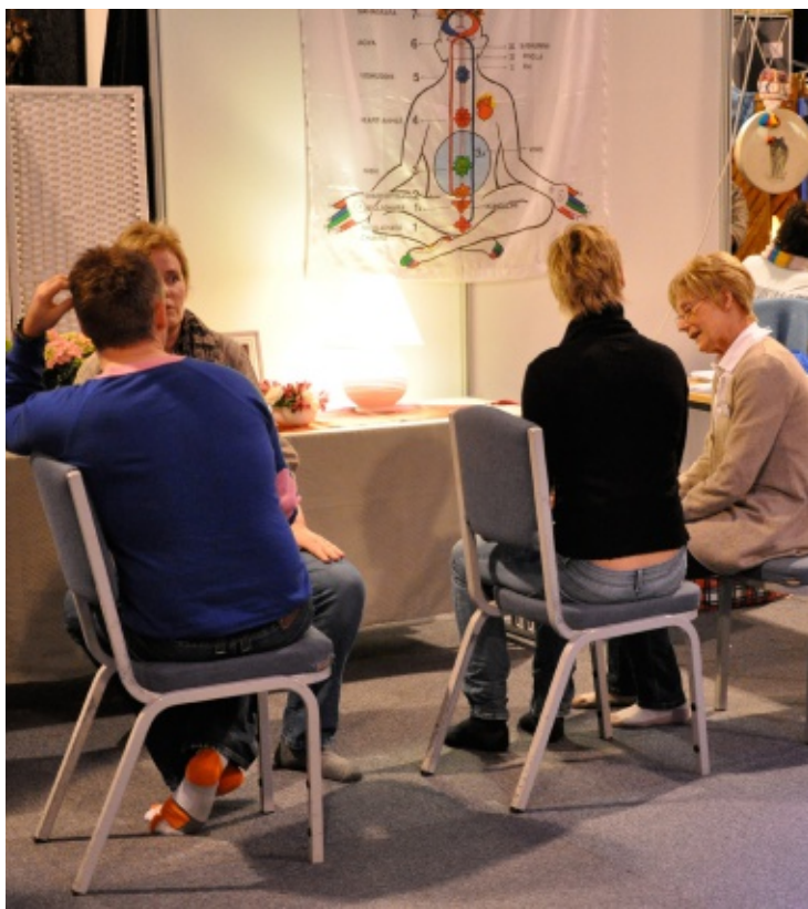
ANDELIGHET: Alternativmesserne arrangeres rundt om i landet. Bildet er fra en slik messe i Oslo i 2011.

het når livet her på jorden er over. Vi setter søkelys på å leve i samklang med de sjelelige aspektene mens man er her, heter det videre i presentasjonen av forbundet.