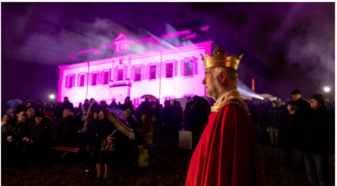
Kaiser Heinrich II. eröffnete persönlich die Geburtstagsfeier im Schlosshof. Foto: