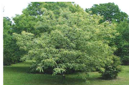
Uppifrån: Acer palmatum 'Osakazuki', japansk dvärglönn med höstfärg. Hamamelis x intermedia 'Diane', trollhassel. Castanea sativa 'Argenteomarginata', brokbladig äkta kastanj.

decennier och där fått upp ögonen både för den vackra parkmiljön och för växternas underbara värld. En annan presumtiv vänföreningsgrupp borde finnas bland alla de återkommande besökarna från näraliggande såväl som mera fjärran belägna orter.