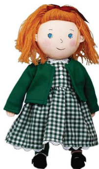
Docka från Hjelm Förlag