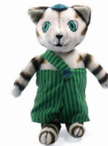
Docka från Hjelm Förlag