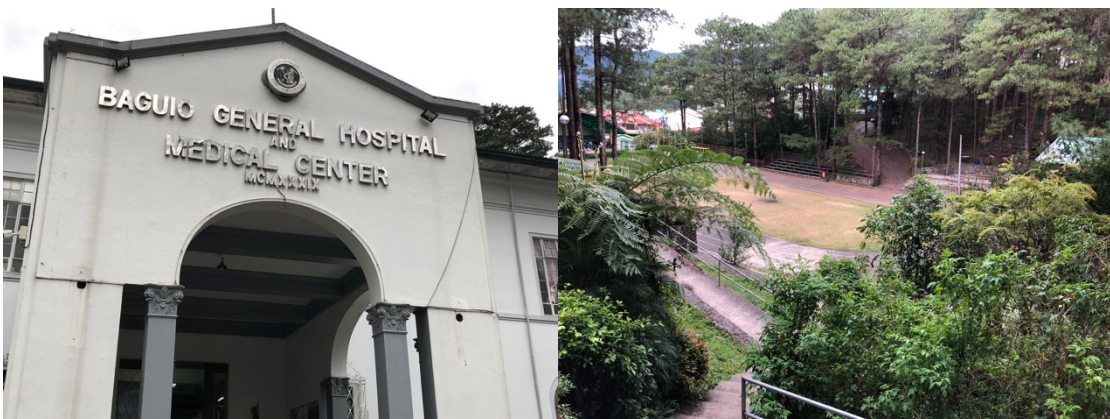
Foto 6. a) Baguio General Hospital. b) Father Rafaël Desmedt Athletic Oval, Maryheights campus, SLU.

We stopten ook nog kort aan Baguio General Hospital waar hij kapelaan was en bij de Maryheights campus van SLU waar de atletiekpiste naar hem genoemd is (foto's 6).