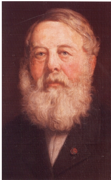
Jean-Servais STAS (1813-1891)

In die zin is zijn onderneming de test om zijn ideeën over landbouw en scheikunde in praktijk om te zetten. Op de site beschikte hij ook over een laboratorium 8,9 waar hij in samenwerking met zijn vriend professor Jan Stas van Gent, onderzoek uitvoerde naar meststoffen en daarnaast grondmonsters testte op samenstelling.” 10