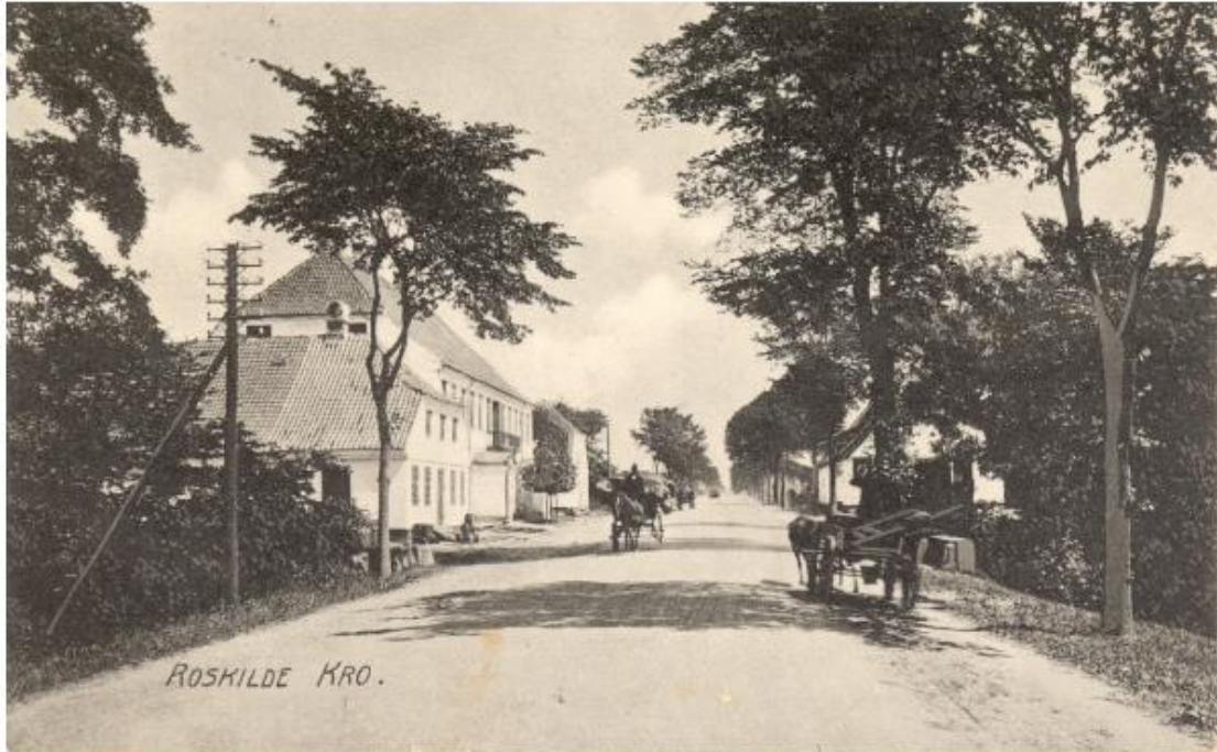
Roskilde Kro før første Verdenskrig.

dre Roskildevvej – hvor den allerede havde en lang historie.