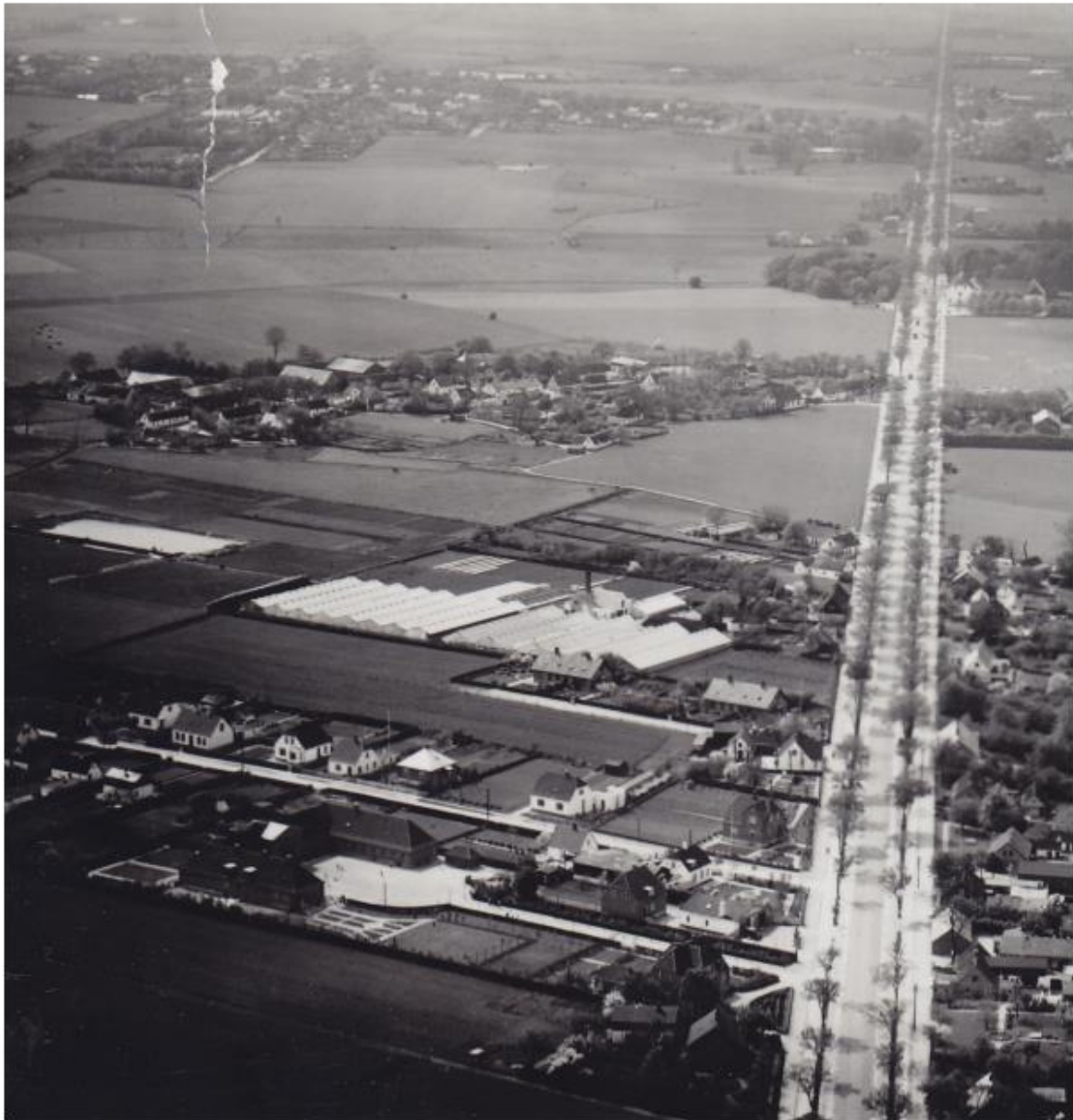
Dette luftfoto er selvfølgelig ikke fra 1808 – men på billedet man se landsbyen Vridsløselille i sin fulde udstrækning fra før byudviklingen. Ved Roskildevej ses kroen ses til højre.