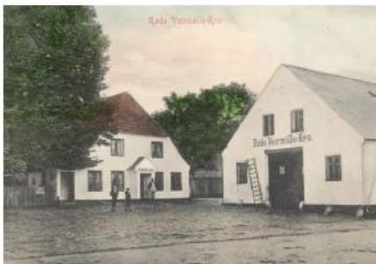
Røde Vejmølle Kro før første Verdenskrig.

I 1960 købte benzinselskabet Esso Røde Vejmølle kro, Kroen blev revet ned og selskabet opførte en service-station på stedet. Rejsestalden blev dog bevaret og der blev indrettet et serviceværksted. En fredag eftermiddag i 1968 skete en voldsom eksplosionsbrand i værkstedet. Ilden opstod, da en mekaniker var i færd