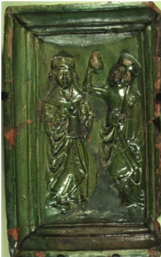
Kakkel fra slutningen af 1400 -tallet. Kaklen forestiller lægehelgenerne Cosmas og Damianus