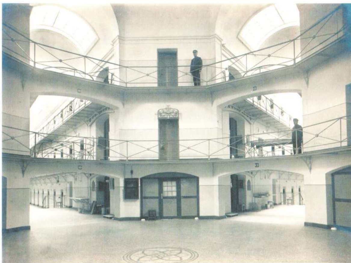
"Centralen" og de åbne cellefløje.