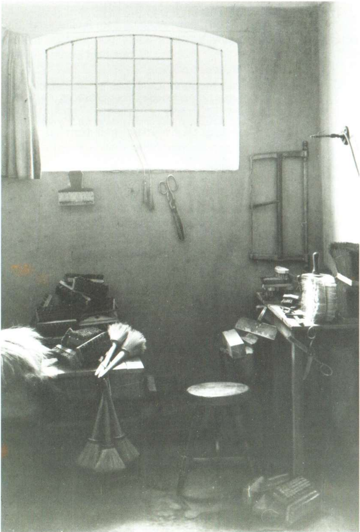
Cellen omkring 1870. Fangen både sov og arbejdede her.