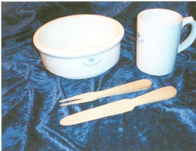
Bestik fra fængslet.

de teorier, man brugte i behandlingen af de indsatte i Vridsløselille. Derfor begrænsede fællesskabet i juledagene sig til en fælles gudstjeneste i fængslets kirke. Julens måltider blev serveret i cellerne, så fangerne kunne sidde i ensomhed, ligesom de plejede.